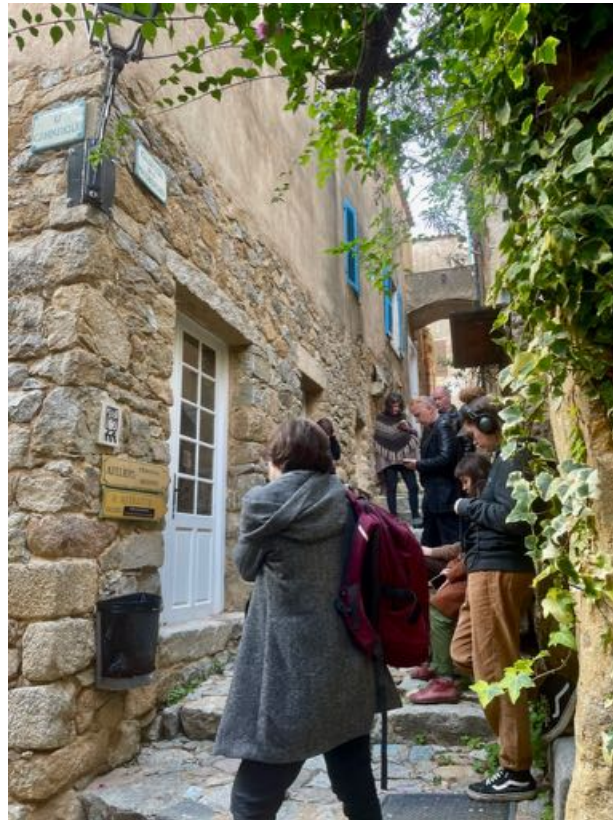
Public écoutant lors de l'inauguration , 23/02/2023.

« Je pense que pour les touristes ça va leur donner une image encore plus culturelle et un rapport plus profond au village, plutôt que simplement commercial. Ça peut en très peu de temps donner une dimension sociale et culturelle, même sans explications, ça montre un travail. »