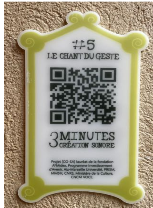
Panneau réalisé par le FabLab Corti - Université di Corsica Pasquale Paoli.