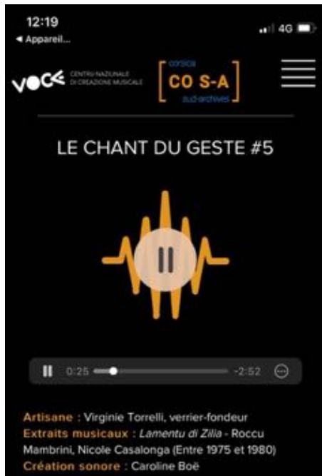
Capture d'écran du player son sur smartphone.