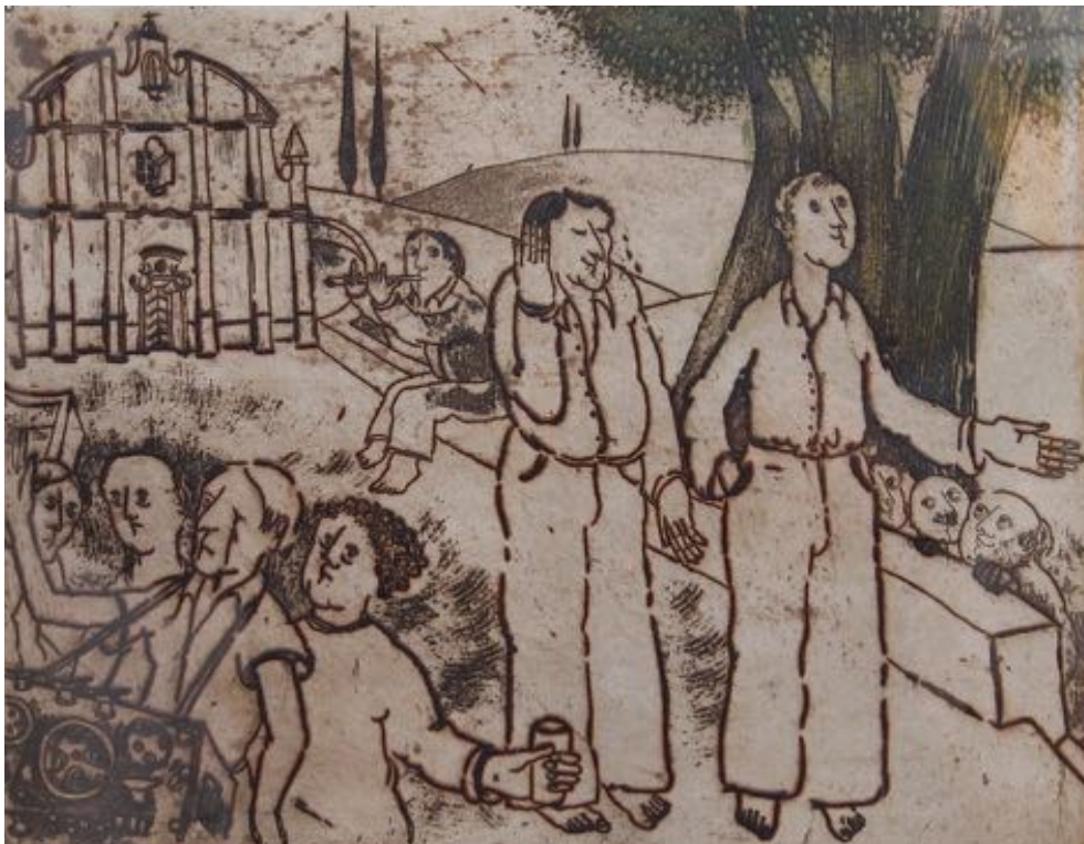
Iannis Xenakis enregistrant deux poètes sur un Nagra. © Gravure de Toni Casalonga 1970