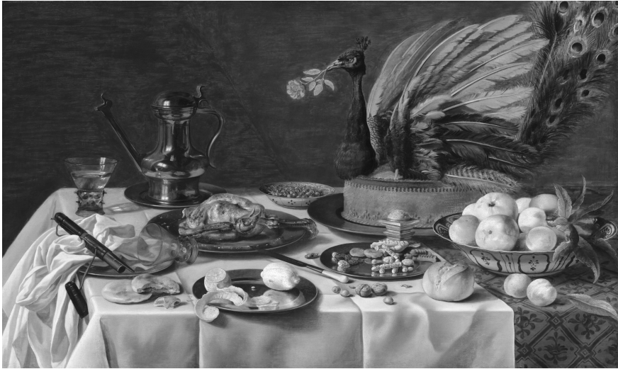
Figure 2. Pieter Claesz, Nature morte au pâté de paon, 1627, huile sur bois, 77,5 × 128,9 cm, The Lee and Juliet Folger Fund.

À la vérité, y compris dans les tableaux de Vanité, il est difficile de limiter l'image à la sphère de l'œil où se dialectiseraient le piège de la promesse et la certitude lucide de la frustration. Au contraire, même quand elles déclinent l'éphémère dont l'aliment destiné à sa rapide disparition est le support, les images ne s'adressent pas uniquement à la vue : elles conjuguent le goût, l'odorat et le toucher. Elles superposent ou entretissent les voies sensorielles qui animent le sensible. L'approche de l'image par le biais de la faim, à laquelle invitent exemplairement les représentations plastiques de l'aliment, permet de brancher l'optique sur la globalité du corps sensible ; elle aide à penser l'incarnation de l'image dans sa matérialité foncière et ses effets de présence.