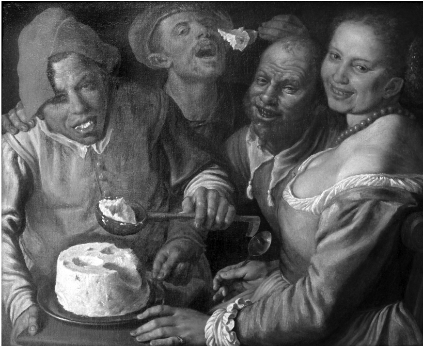
Figure 3. Vincenzo Campi, Les Mangeurs de ricotta , 1580, huile sur toile, 33,6 × 26,3 cm, Lyon, Musée des Beaux-Arts.

Je voudrais, pour finir, m'arrêter sur un exemple que je regarderai comme une allégorie du partage sensible et symbolique du repas quand il tend à l'image ou de l'image quand elle tend au repas. Il est emprunté à Vincenzo Campi, un peintre italien de la fin du XVI e siècle. Parmi ses tableaux, Les Mangeurs de ricotta représente une assemblée de bons vivants qui savourent une généreuse portion de ricotta. Les personnages ont déjà entamé le fromage et ils nous regardent (Figure 3). En quelque sorte, ils nous invitent à prendre part à la dégustation. Ils nous montrent l'exemple : l'un d'eux, l'homme au chapeau rouge, paraît même nous offrir sa louche bien pleine afin que nous la portions à notre bouche. Le tableau est offrande, il est même communion et ressemble à une version parodique et burlesque du dernier repas du Christ, la ricotta à la place de l'hostie.