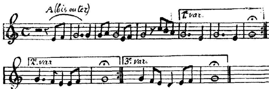
FIG. 36. — Modulation du chant hindou. Le sol final des trois variations a été tenu jusqu'à 14 secondes avec une fixité parfaite. Souvent la suite A a été bissée ou trissée avant la continuation.

Figura 1 — Modulación del canto hindú. El sol final de las tres variantes fue sostenido hasta 14 segundos con una fijeza perfecta. A menudo, la sección A se repitió dos o tres veces, antes que el resto.