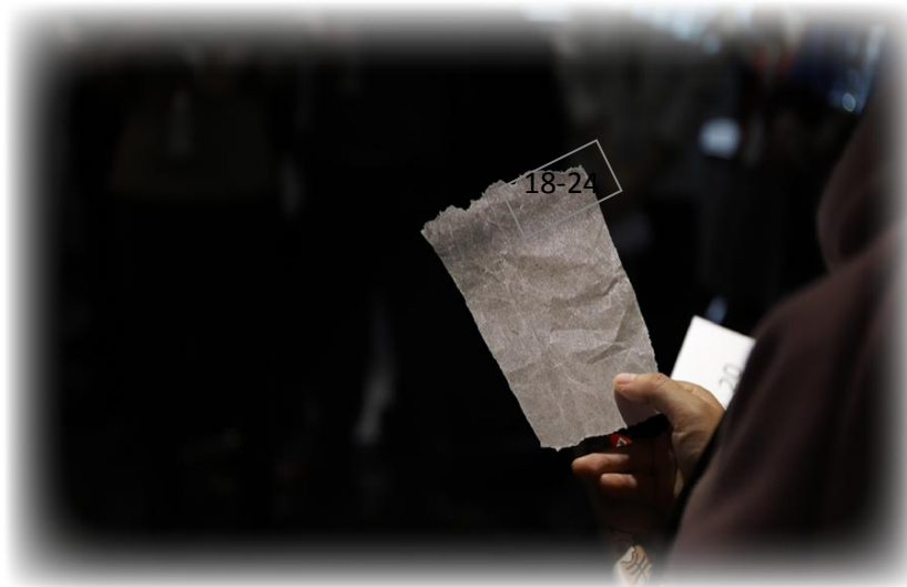
Illustration 04. Copie écran d'exemple de codes à retenir