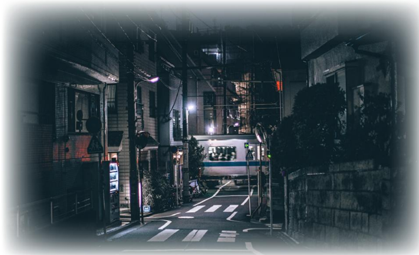
Illustration 05. Copie écran d'éléments à déplacer

Ainsi, le joueur passe d'une mission à l'autre après avoir réalisé différentes activités demandant la recherche d'information et/ou de codes secrets. En cas de réponses incorrectes aux activités proposées, le lycéen revient sur la page précédente et recommence l'activité. Il ne peut avancer à l'étape suivante que lorsqu'il a réalisé l'intégralité des activités qui lui sont proposées. L'escape game se termine lorsque le lycéen a réalisé l'intégralité des missions. Il sort alors de la pièce mystère :