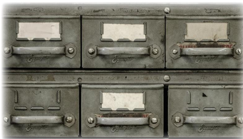
Illustration 01. Copie écran des différentes missions

Au commencement de la partie, le joueur-lycéen découvre une série de tiroirs correspondant à différentes missions à mener pour sortir de l'espace (sombre) dans lequel il est entré :