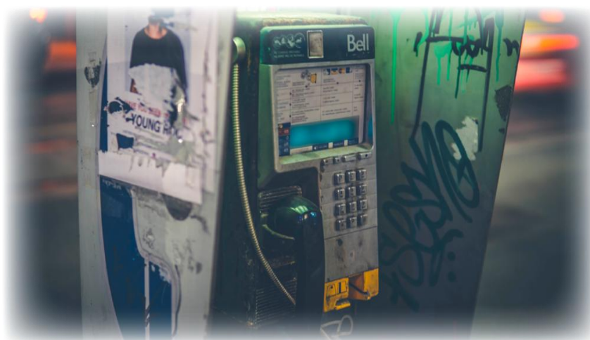
Illustration 03. Copie écran d'exemple de codes à trouver sur le téléphone

Cette première étape passée, les lycéens naviguent à travers plusieurs espaces qu'ils visitent et dans lesquels il peut découvrir des mots ou des codes (à mémoriser) en faisant glisser des objets présents dans le décor proposé.