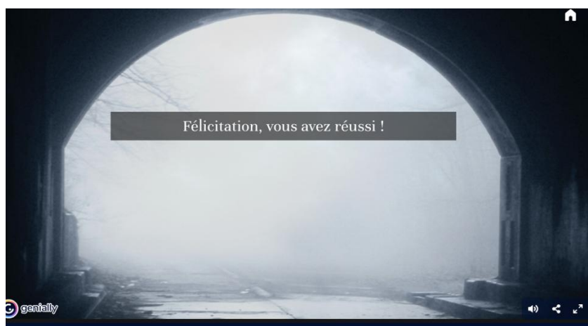
Illustration 06. Copie d'écran de fin de l'escape game, sortie de la pièce (vers la lumière)

Cet escape game a servi de support à la recherche menée au sein de l'équipe associée au projet SOAN