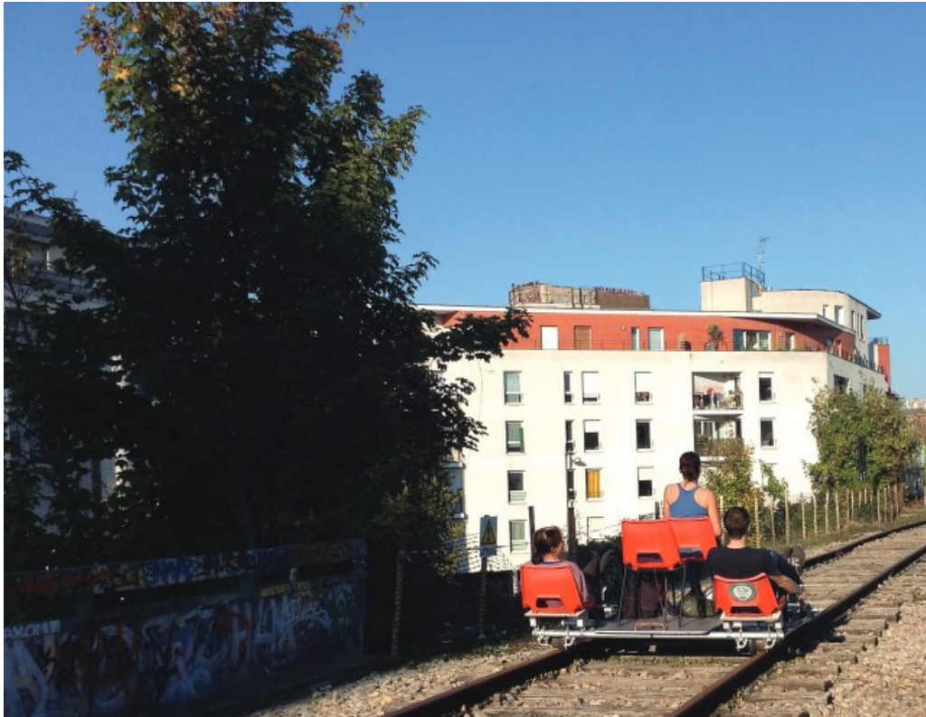
Atelier d'expérimentation de vélo-rail organisé par le Collectif Traverse & Agence Oïkos, Petite Ceinture, Paris 17 e arrondissement, 15 octobre 2017.