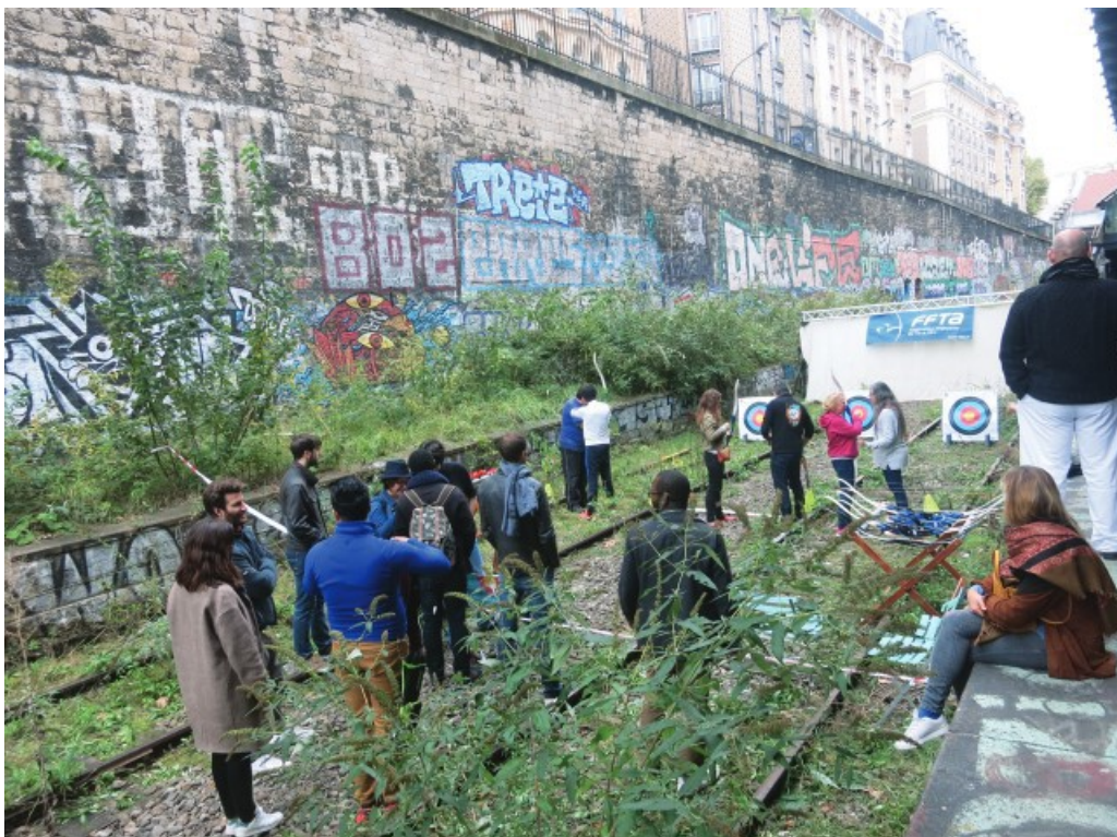
Atelier d'expérimentation de tir à l'arc organisé par le Collectif Traverse & Agence Oïkos, Petite Ceinture, Paris 18 e arrondissement, 7 octobre 2017.