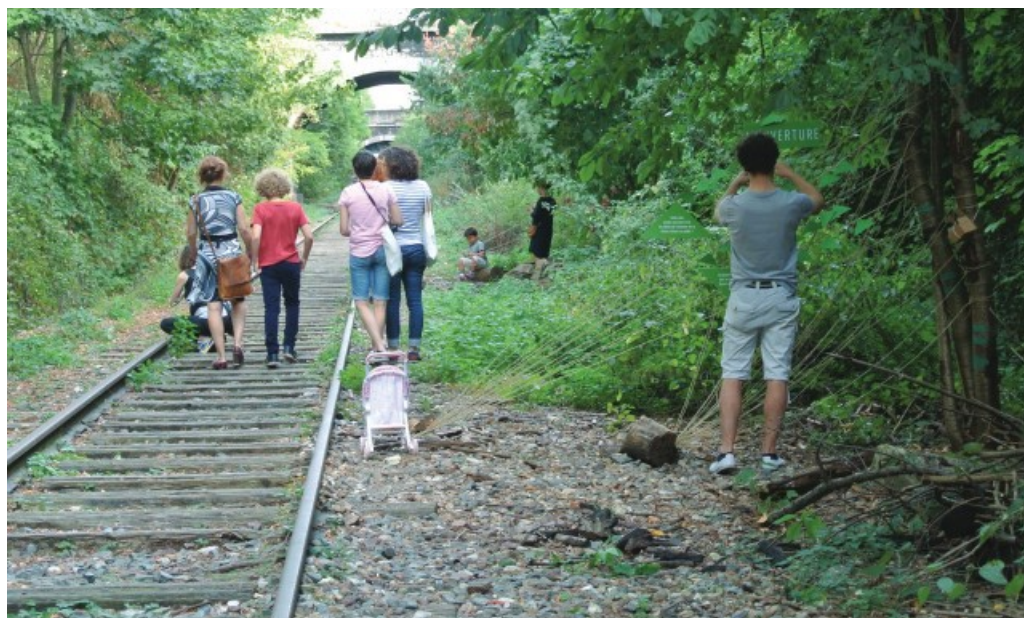
Atelier participatif Attrape-rêves organisé par le Collectif Traverse & Agence Oïkos, Petite Ceinture, Paris 14 e arrondissement, 10 septembre 2016.

De la même manière, une participation également accrue à une vingtaine d'ateliers participatifs s'est faite, en grande majorité en tant qu'animatrice.