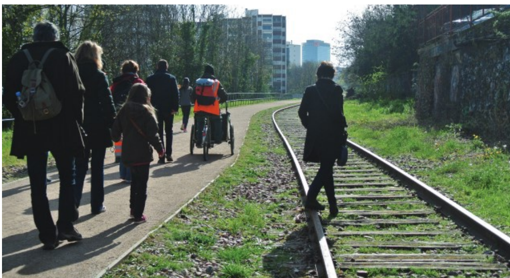
Visite événementielle guidée et organisée pour les adhérents de l'association Espaces d'insertion par l'écologie urbaine, Petite Ceinture, Paris 14 e arrondissement, 9 avril 2016.