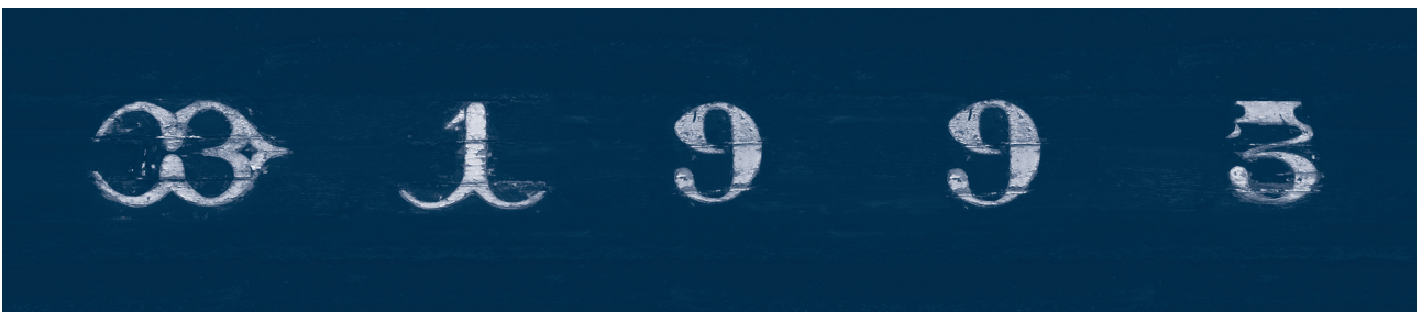
Fig. 10 - Immatriculation de « An Eostig », réplique de chaloupe sardinière, réalisation probable d'Édouard Ansquer, 1993, Douarnenez.

L'été dernier, j'ai proposé à un public de néophytes l'exercice suivant : dessiner au feutre un chiffre sur une feuille de papier où étaient déjà placées les seules parties pleines d'un chiffre, laissant à chacun le loisir de le compléter en reliant librement les modules entre eux. Le résultat est formidable {Fig. 11}. Tous les signes semblent appartenir à la même famille, structurés et tendus par le passage obligé des fûts, et tous différents par les options subjectives prises pour le cheminement des déliés – et souvent par l'ajout d'ornements. Cette méthode expérimentale n'a peut-être pas une grande valeur scientifique, mais elle a le mérite de démontrer que chacun, équipé d'un outil qui combine gabarit (informations spatiales élémentaires : le cadratin et ses lignes médianes) et pochoir (quelques éléments immuables qui garantissent quoi qu'il arrive la reconnaissance du signe), peut parvenir à un résultat normé et unique ! Deux témoignages tendent à consolider l'hypothèse : l'un oral, l'autre photographique.