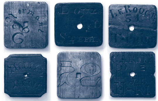
Fig. 8 - Markezen, marques de filet. Collection privée.

Selon l'avis des anciens le style de l'alphabet « à barbes » fut inventé afin de rendre les chiffres « pêchants ». Comprendre : pour présenter aux flots une silhouette ronde (comme les 0, 2, 3, 5, 6, 8 et 9) qui ne heurte pas le génie de la mer et apporte la fortune. Certains patrons allant même jusqu'à poser des « options » sur un numéro favorable au bureau de l'administration maritime avant la construction du bateau ! Mais un autre témoin – marin graveur lui-même – rejette cette hypothèse superstitieuse et parle plus volontiers de motivations purement esthétiques. Loin d'être incompatibles, ces points de vue éclairent avant tout la complexité des mentalités de l'époque et les représentations contradictoires que l'on a d'elles a posteriori : un peuple certes bourru mais voyageur, passablement illettré et pourtant bilingue, régionaliste dans l'âme mais fervent patriote, légitimiste de condition et communiste de conviction, pieux jusqu'à la dévotion et malgré tout bon client de remèdes païens capables de conjurer le mauvais œil... Alors, le motif de cette graphie : identitaire, artistique ou propitiatoire ?