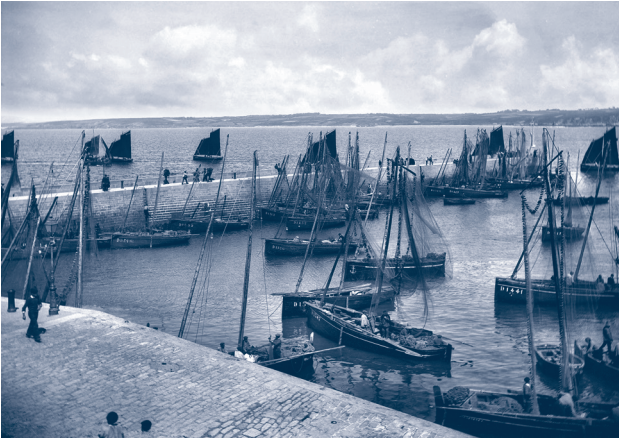
Fig. 2 ~ Douarnenez, le môle, Neurdein, ca 1885.