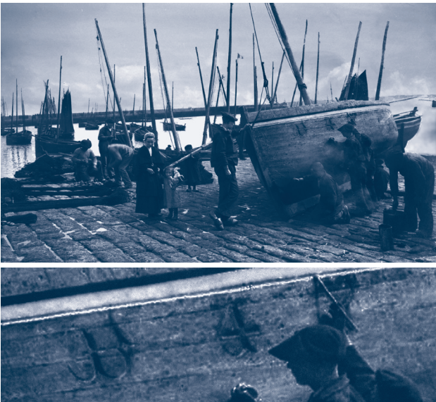
Fig. 3 ~ Carénage d'une barque sur les quais, ca 1900. Fonds Villard. © Archives départementales du Finistère.