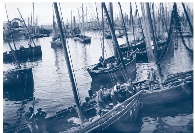
Fig. 5 ~ Port de Douarnenez, Charles Géniaux, ca 1904. © Collection musée de Bretagne, Rennes.