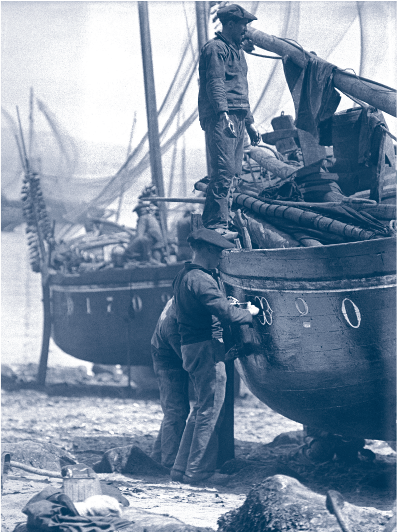
Fig. 1 - Pêcheur préparant son bateau sur la plage de Douarnenez , Robert Demachy, ca 1911. © Musée Nicéphore Niépce, ville de Chalon-sur-Saône.