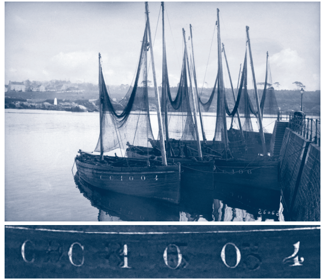
Fig. 4 ~ Concarneau, le séchage des filets, 1913.

En observant de nombreuses images de 1900, un constat s'impose : ces formes soudaines et extravagantes sont plus que de simples envies individuelles de marins pêcheurs souhaitant customiser leur propre véhicule. En réalité, les variations s'observent davantage d'une flotille entière à une autre qu'entre deux bateaux du même bassin. Ces entorses au modèle et la réappropriation des inscriptions sont donc une œuvre collective de chaque quartier maritime, capable à la fois de fédérer les marins du même port (où règnent la fraternité et un puissant sentiment d'appartenance) et de les distinguer du port voisin (avec qui la concurrence en mer est rude et les relations souvent franchement hostiles).