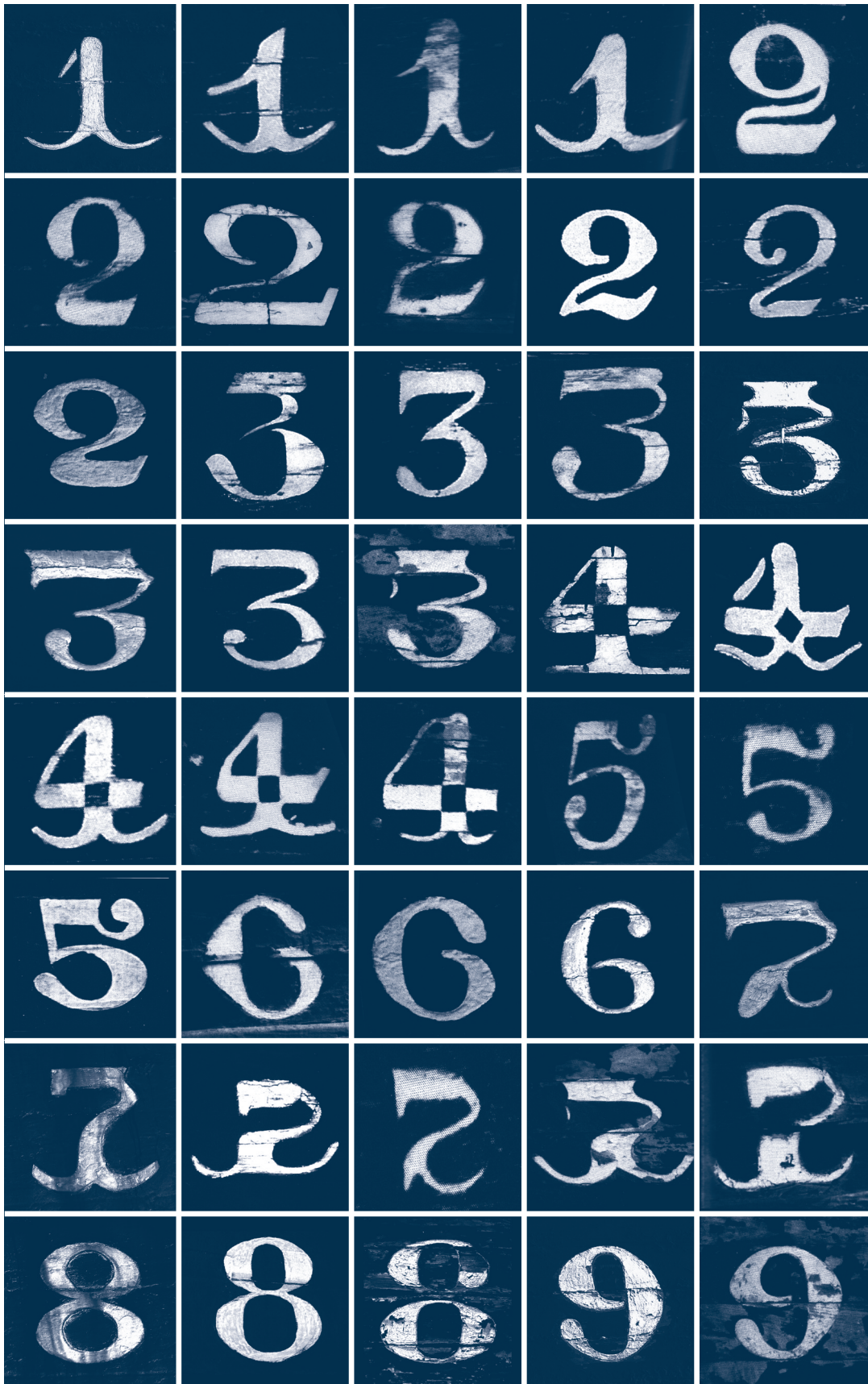
Fig. 9 - Divers signes dans le style dit « à barbes », mélange de relevés et de photographies, époques et localisations diverses. Droits réservés.