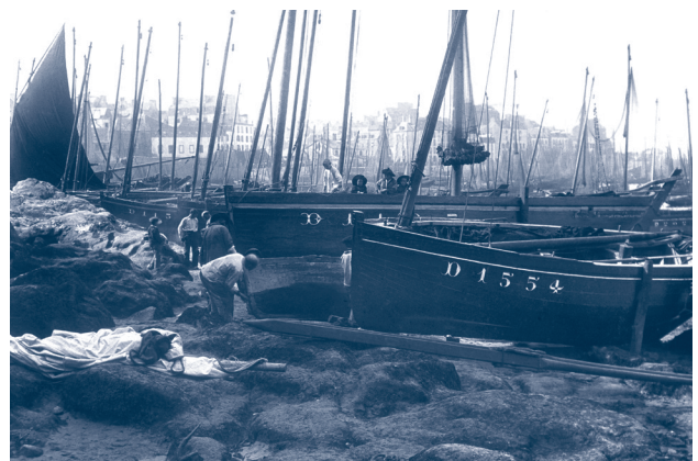
Fig. 6 ~ Marins préparant leur bateau sur la plage de Douarnenez, Robert Demachy, ca 1911. © Musée Nicéphore Niépce, ville de Chalon-sur-Saône.