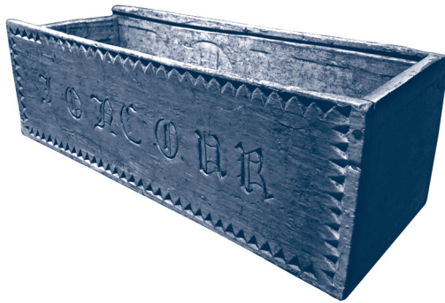
Fig. 7 - Boîte d'effets personnels, date inconnue, probablement années 1930. Port-musée, Douarnenez.