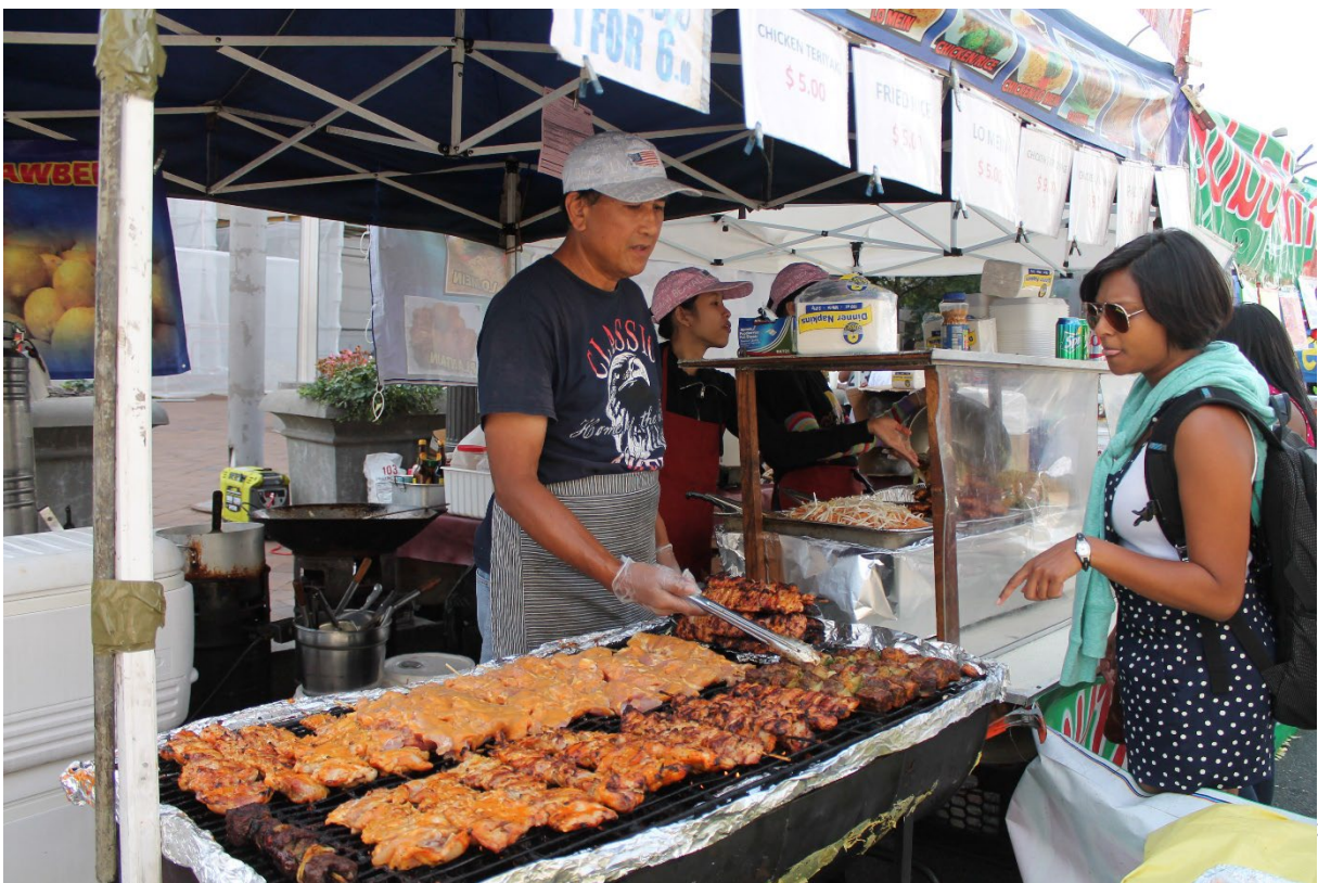
Cuissons et grillades simultanés en plein air donnent leurs identités odorantes à des lieux-moments. Festival de musique et d'arts caribéens et éthiopiens, ville de Washington (Etats-Unis) septembre 2014