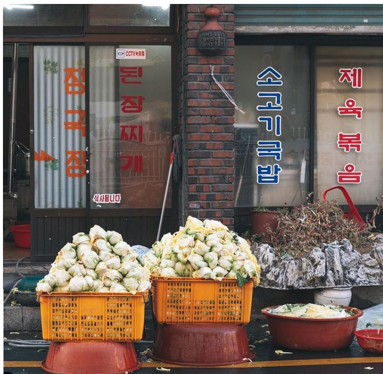
Prémices de préparation de kimchi dans une rue de Daegu (Corée du Sud), décembre 2020.

Les reconstitutions des identités odorantes de lieu par nos souvenirs ou par certains travaux littéraires font cependant des raccourcis qui ne correspondent pas tout à fait au caractère fragmenté de nos expériences olfactives quotidiennes. Connaître ces dernières nécessite donc une approche située, c'est-à-dire de terrain. Mais les sensations olfactives sont difficiles à décrire et ne débouchent pas obligatoirement sur un nom – celui d'une source potentielle ou avérée. Le plus souvent, il faut arriver à localiser la source de la sensation odorante pour être capable de la nommer, puisque dans la culture occidentale on nomme les odeurs d'après leurs sources. C'est pourquoi nombre de travaux de terrain se contentent d'inventaires de sources odorantes, soit évoquées lors d'entretiens soit détectées pendant des arpentages in situ . Comme les sources de molécules odorantes sont très nombreuses dans nos environnements quotidiens, les chercheurs font des synthèses de leurs inventaires sous forme de catégorisations, souvent discutables, le plus souvent par types de sources, plus rarement par types de sensations olfactives.