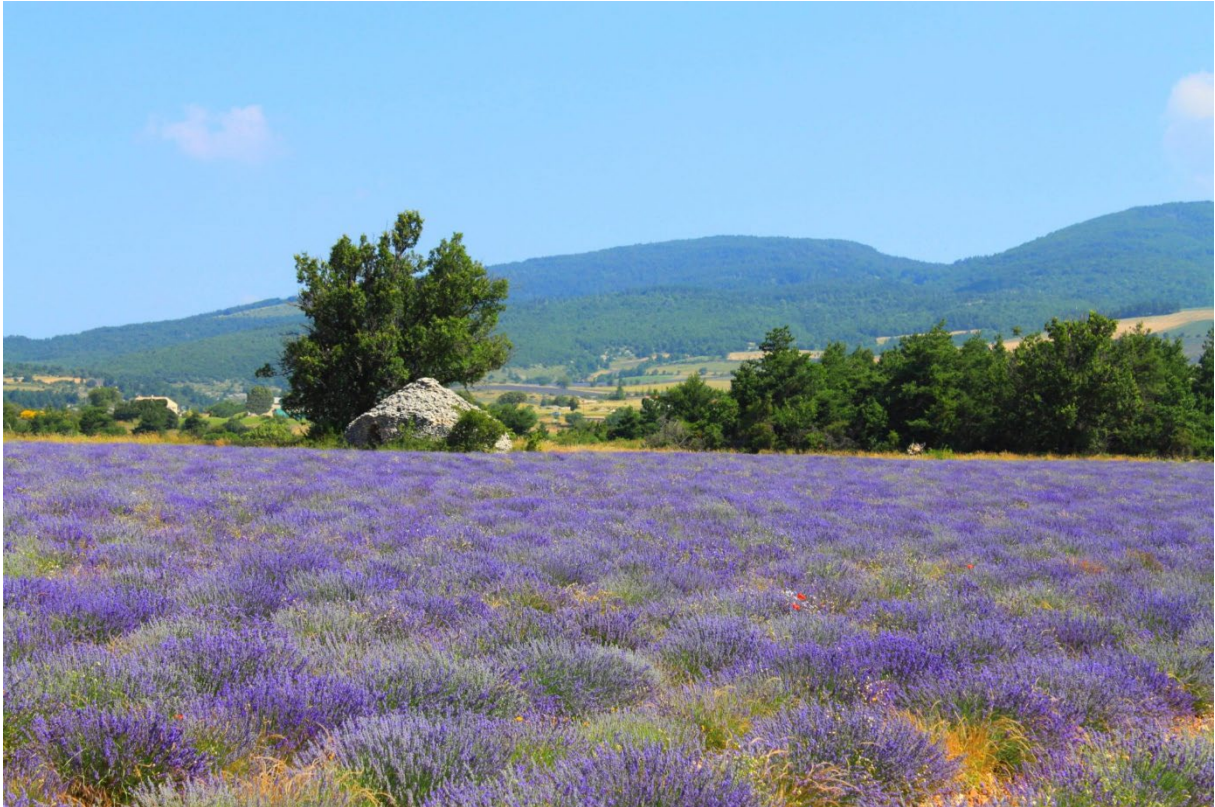
Drôme provençale, territoire d'activités humaines odorantes ( https://www.drome-provencale.fr/wp-content/uploads/2018/06/paysage-lavande-drome-provencale-ct-1.jpg )