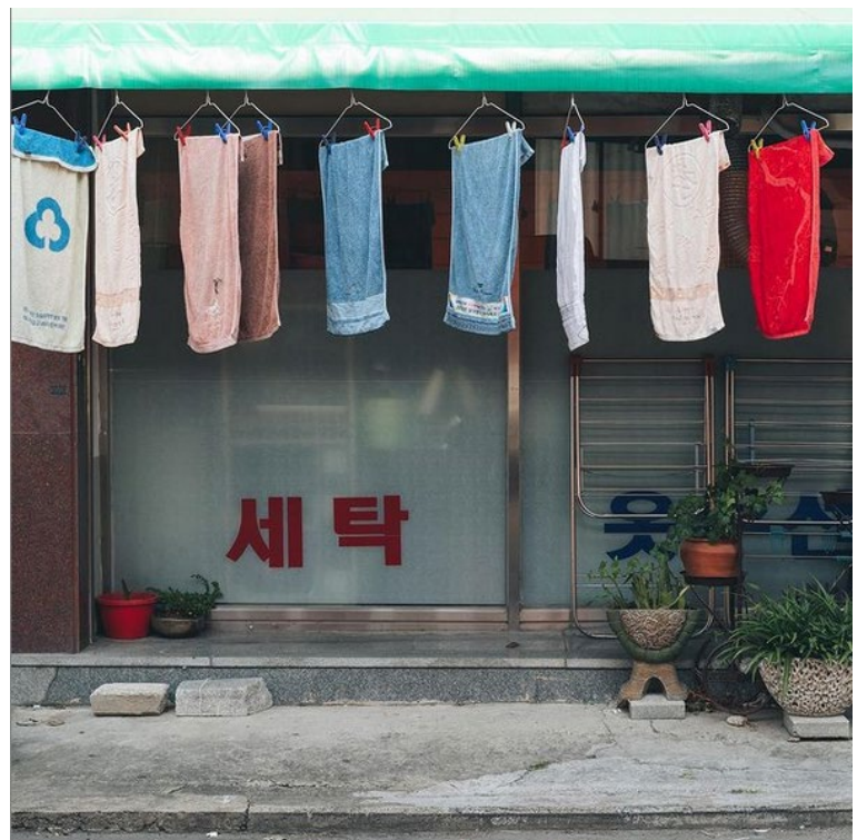
Devanture d'une laverie Daegu (Corée du Sud), novembre 2020.