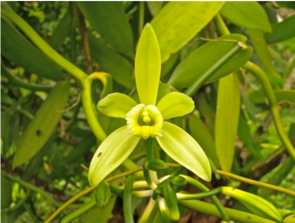
Illustration de la couverture :

On Phaeochrous thomensis Arrow, 1909 (Coleoptera, Scarabaeoidea, Hybosoridae). Denis Keith & Alain Coache ..... 1 – 5