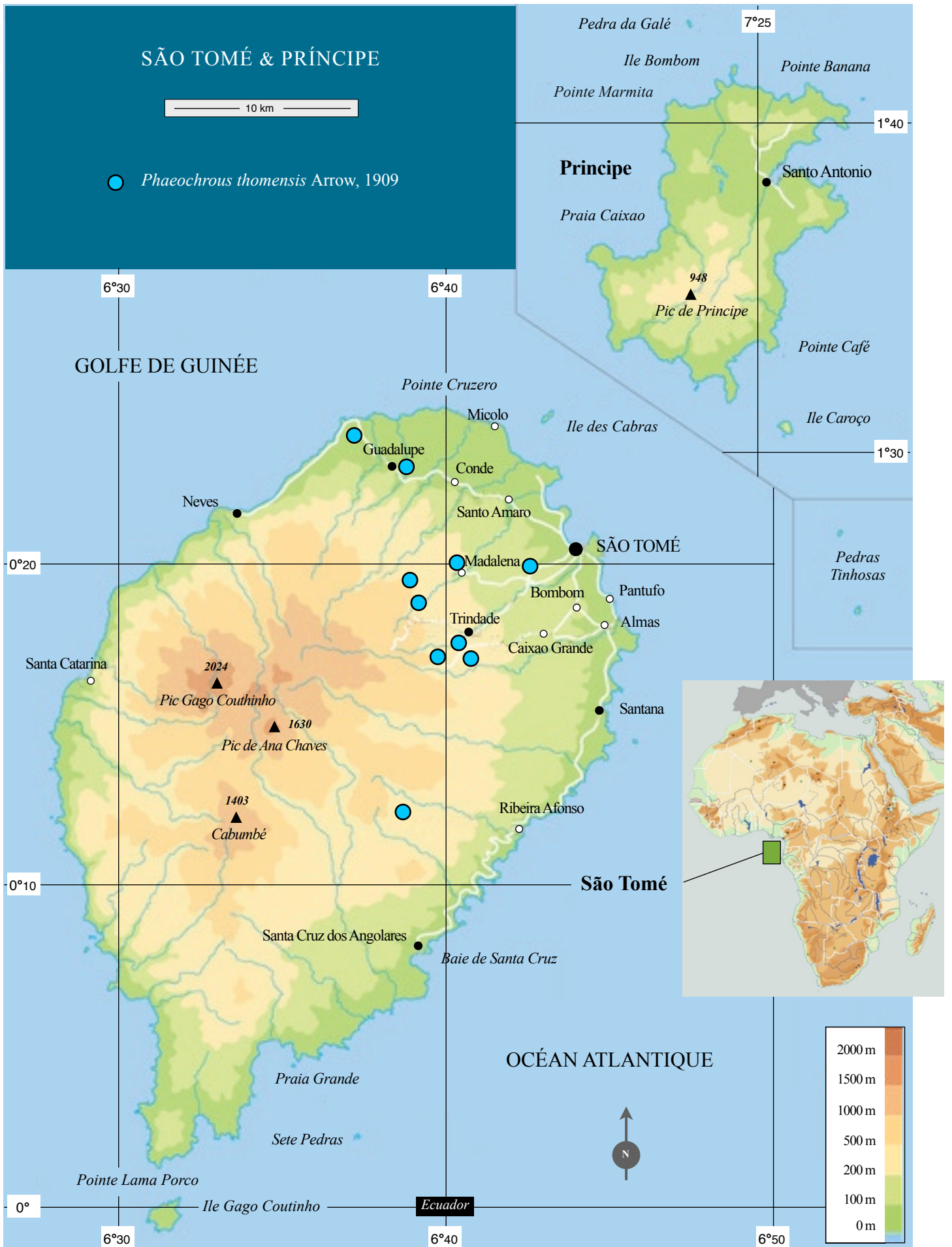
Carte 1. Répartition de Phaeochrous thomensis Arrow, 1909.