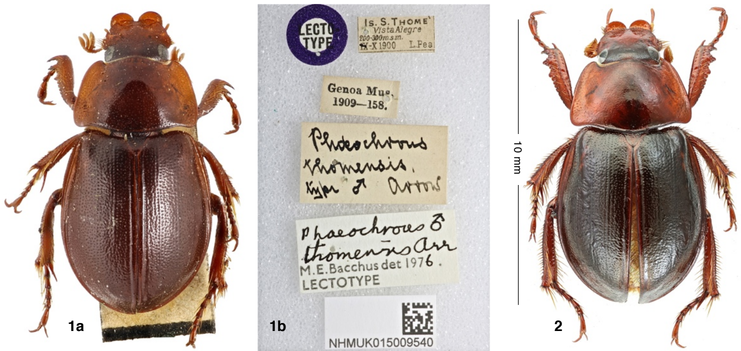
Fig 1-2. Phaeochrous thomensis Arrow, 1909.

1a. Lectotype. 1b. Labels du lectotype. 2. Sao Tomé, Route du CIAT, 30-X-2021.