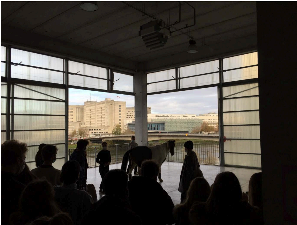
Figure 1. La ponette dans le studio de projet, Nantes