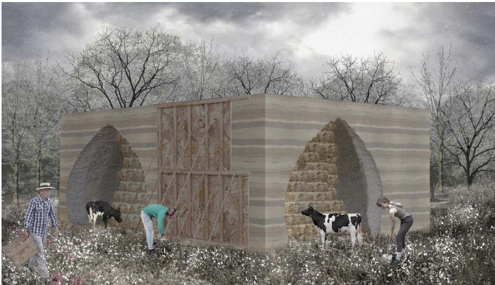
Figure 2. Ferme pédagogique de Freaks, Strasbourg