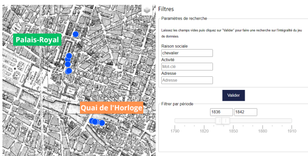
FIGURE 3 – Les ateliers dont les propriétaires se nomment "Chevalier" se concentrent dans deux quartiers.

semble des scripts relatifs à ce travail, l'ontologie et l'application de visualisation : https://github.com/soduco/ic_2023_photographes_parisiens