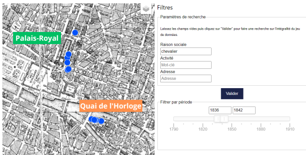
FIGURE 3 – Les ateliers dont les propriétaires se nomment "Chevalier" se concentrent dans deux quartiers.

semble des scripts relatifs à ce travail, l'ontologie et l'application de visualisation : https://github.com/soduco/ic_2023_photographes_parisiens