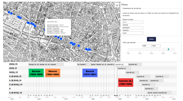
FIGURE 4 – Phénomène de transmission probable d'un atelier entre photographes.

Dans cet article, nous avons proposé une approche pour créer et analyser un graphe de connaissances géohistoriques sur des commerces d'un type donné, à partir d'annuaires du commerce anciens. Les deux stratégies de liage adoptées permettent de créer suffisamment de liens entre entrées représentant un même commerce au cours du temps pour