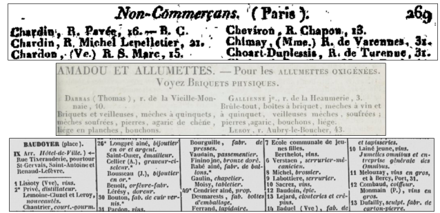
FIGURE 1 – Exemples de mises en pages et d'index différents dans les annuaires En haut : Duverneuil et La Tynna 1806 - index par noms ; Au milieu : Deflandre 1828 - index par professions ; En bas : Bottin 1851 - index par rues.

Les informations contenues dans les annuaires peuvent être vues comme des séries temporelles de données semi-structurées sur les commerces qu'elles décrivent. Nous proposons donc une approche d'extraction d'informations et de construction de graphe de connaissances qui reprend et adapte les étapes de la chaîne de traitement de [4] et les approches à base de liage de [6], [15] et [5].