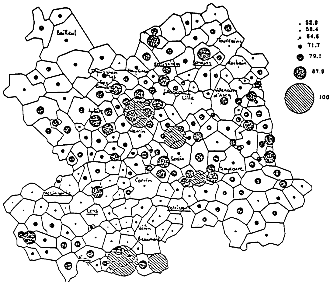
Carte 1 - Proportion de ménages disposant d'une automobile