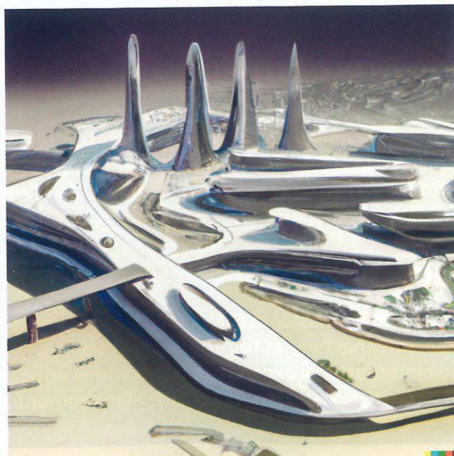
Figure 1. Deux rendus produits par l'AI dans les styles de Le Corbusier (à droite) et Zaha Hadid (à gauche).