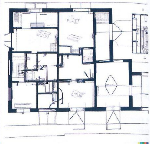
Figure2. Deux plans générés par DALL-E