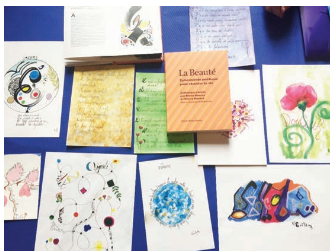
Figure 3. Productions et pratiques d'art-thérapie dans le terrain de cette recherche (dessins, lectures), D.R.