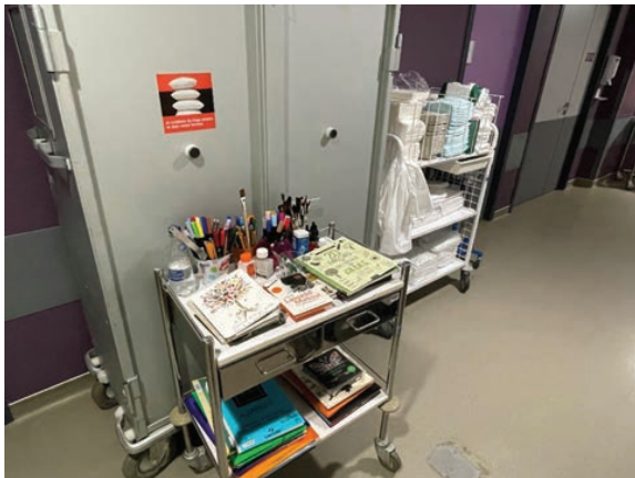
Figure 2. Chariot de l'art-thérapeute (photo issue d'une journée d'observation, D.R.)

« Il faut prendre toutes les dimensions du patient. Somatique, psychologique, sociale, spirituelle. Le patient vient avec ce qu'il est, son histoire. Des fois des grandes engueulades de couple, des mariages, en fin de vie avec un patient qui n'est plus en état de faire cela, on accompagne dans les démarches », cadre 3C.