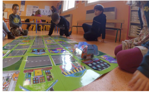
Figure 2 - Des élèves s'initient à la pensée informatique avec pour objectif programmer un robot qui récupère des déchets