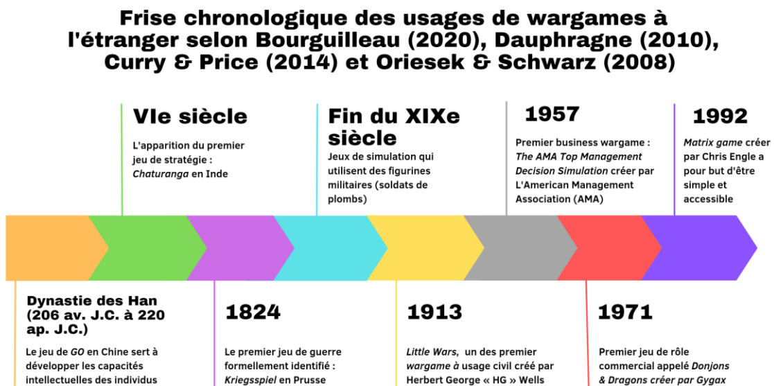
Figure 1. Frise chronologique des usages de wargames à l'étranger selon Bourguilleau (2020), Dauphragne (2010), Curry & Price (2014) et Oriesek & Schwarz (2008).

méthode de simulation de stratégie d'affaires qui utilise des principes et des techniques similaires à ceux des wargames militaires et des jeux de rôles type Donjons & Dragons pour explorer les défis commerciaux, évaluer les options stratégiques et renforcer la prise de décision en situation de crise. L'American Management Association (AMA) fut le premier à concevoir un business game de ce type connu sous le nom de The AMA Top Management Decision Simulation . Ce jeu a été largement utilisé aux États-Unis et a stimulé l'apparition de nouveaux jeux fondés sur le même modèle (Greenblat & Duke, 1975). En milieu des années 80, le business game a évolué en s'adaptant aux enjeux stratégiques, retrouvant ainsi ses racines dans le wargame (Ginter & Rucks, 1984). Plus récemment, au début des années 2000, il a axé son attention sur des domaines tels que la formulation de la stratégie ou la validation de stratégies existantes (Kurtz, 2003).