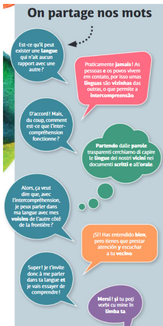
Figura 2 – On partage nos mots.

dos de los enfoques plurales descritos por el CARAP (CANDELIER et al. , 2012). Así, comenzamos reproduciendo un sencillo diálogo en el que un francófono pregunta algunas cuestiones sobre el contacto entre lenguas y recibe las respuestas en portugués, español, italiano y romeno. Este documento forma parte de una revista divulgativa publicada por la Unita (2021), por lo que nuestra aproximación a la intercomprensión se insertaba en el discurso producido desde la propia institución sobre el plurilingüismo y el contacto entre lenguas románicas. Lo reproducimos a continuación en la Figura 2.