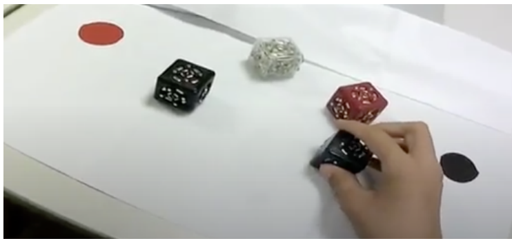
Figure 1 - les quatre pièces de robotique modulaire devant permettre la construction du véhicule autonome

Nous allons maintenant voir que certaines médiations numériques peuvent avoir un impact sur la représentation du numérique c'est-à-dire sont susceptibles d'améliorer les connaissances préétablies des sujets à son égard. Cette modification a lieu lors d'un défi de manipulation qui, dans notre protocole, a été proposé à un élève de quatrième dont la tâche était de construire un véhicule autonome à partir de quatre pièces de robotique modulaire.