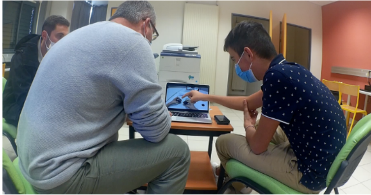
Figure 2 - Entretien de remise en situation pendant lequel le sujet va décrire ce qui était significatif de son point de vue

La figure ci-dessus montre que le sujet est accompagné par le chercheur à enrichir sa vidéo subjective de ses commentaires et de ses gestes à l'écran. C'est une augmentation de la vidéo initiale par des éléments qui font sens du point de vue du sujet parce qu'il lui ont été significatifs pendant la construction du véhicule autonome. Le chercheur va ensuite récupérer ces données dites de verbalisation pour les nommer de manière théorique, créer un effet de surface sur l'expérience vécue (Schmitt, 2018) et ainsi retrouver ce que le sujet a validé ou réfuté comme connaissances sur le numérique.