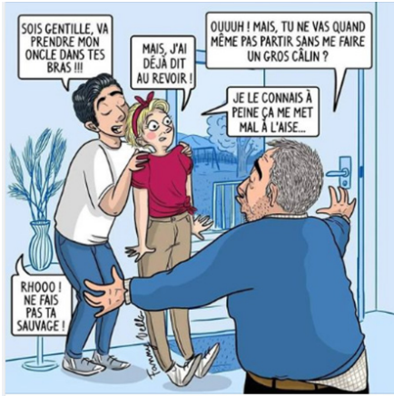
Planche 11. Extrait d' Et si on changeait d'angle sur le bisou