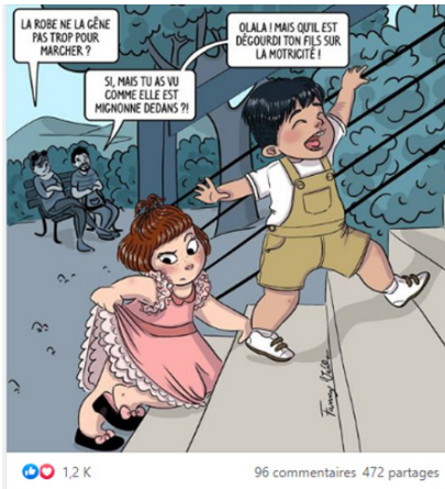
Planche 1. Sans titre, sur la motricité libre