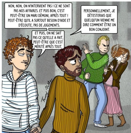
Planche 8. Extrait d' Et si on changeait d'angle