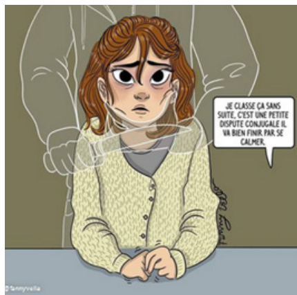
Planche 16. « Classé sans suite »