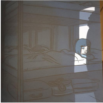
Planche 5. Extrait d' On l'appelait Vermicelle (p. 61)