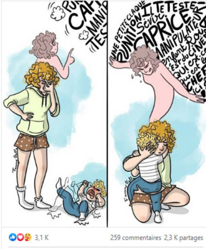
Planche 14. Illustration d'un texte sur les caprices écrit par Sonja du compte @novaswithlove