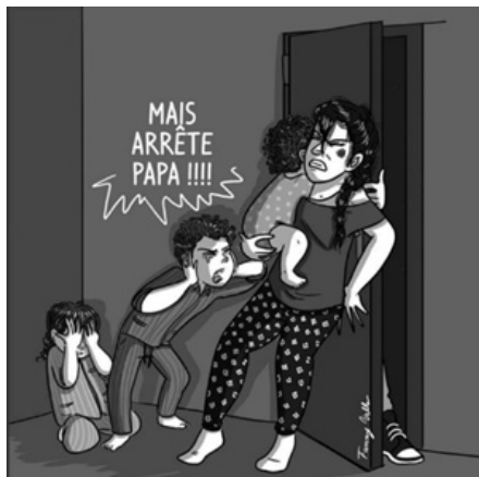
Planche 10. Extrait du guide Le Cycle de la violence