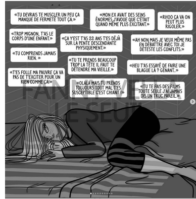
Planche 6. Extrait de Le Seuil (p. 101)