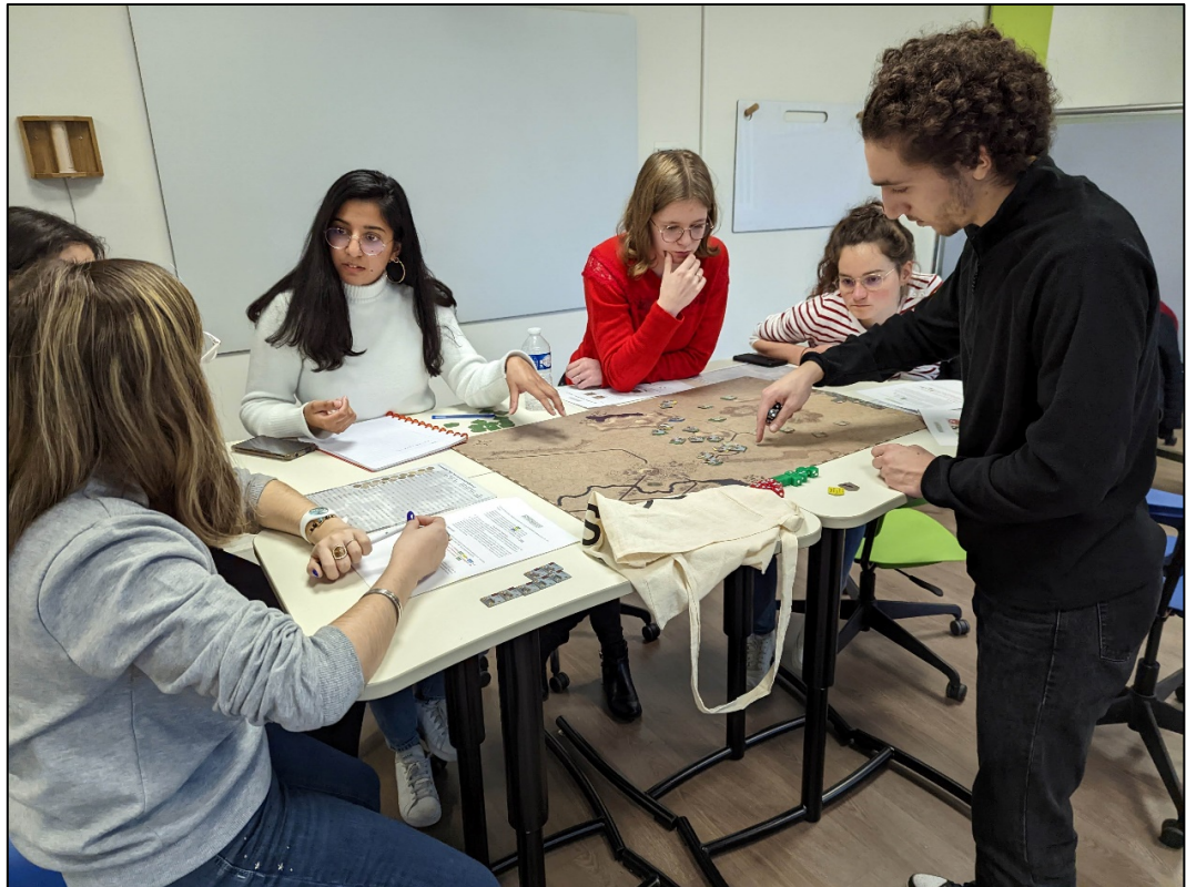
Figure 3. Le jeu sur table Armageddon War (promotion 2022-2023).