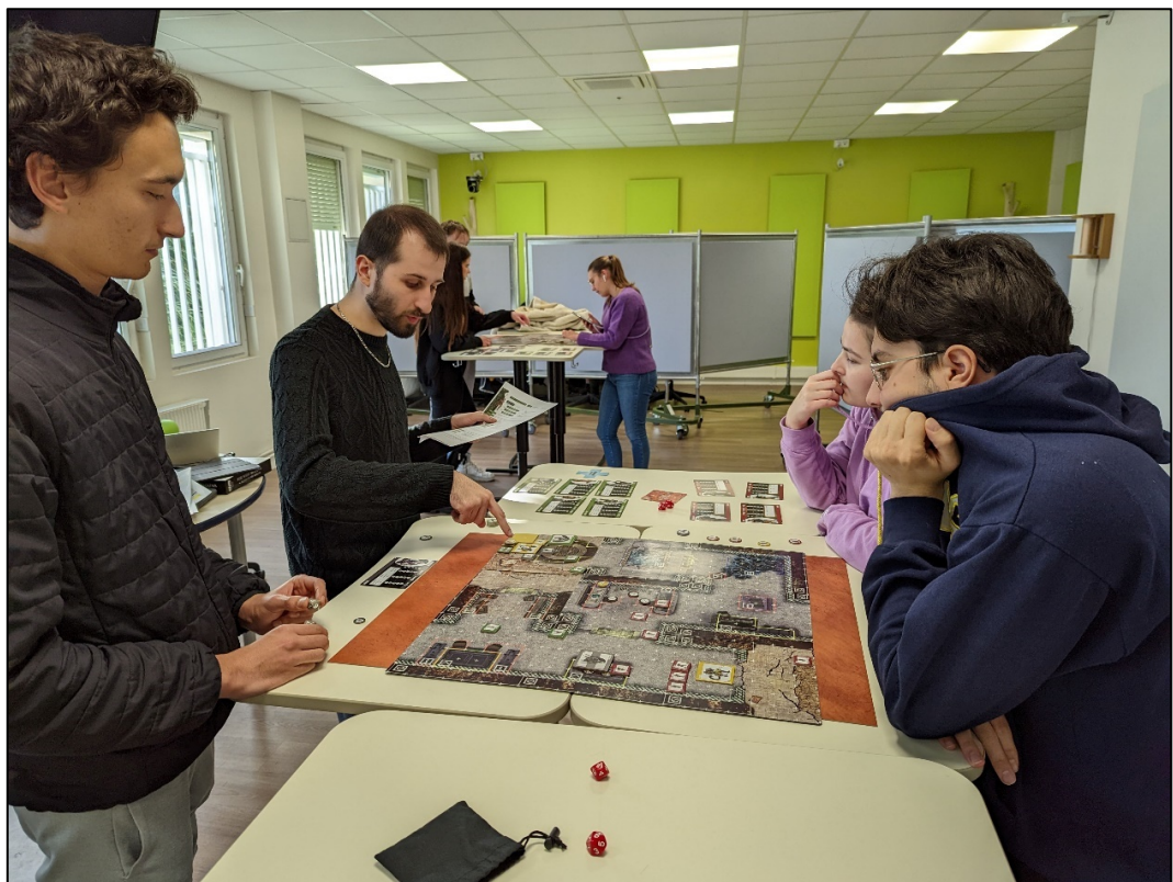
Figure 4. Le jeu sur table For What Remains (promotion 2022-2023).