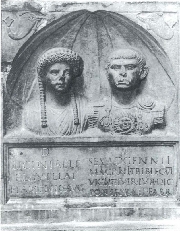
Monument de Sex. Adgennius Macrinus, Nîmes, Musée archéologique