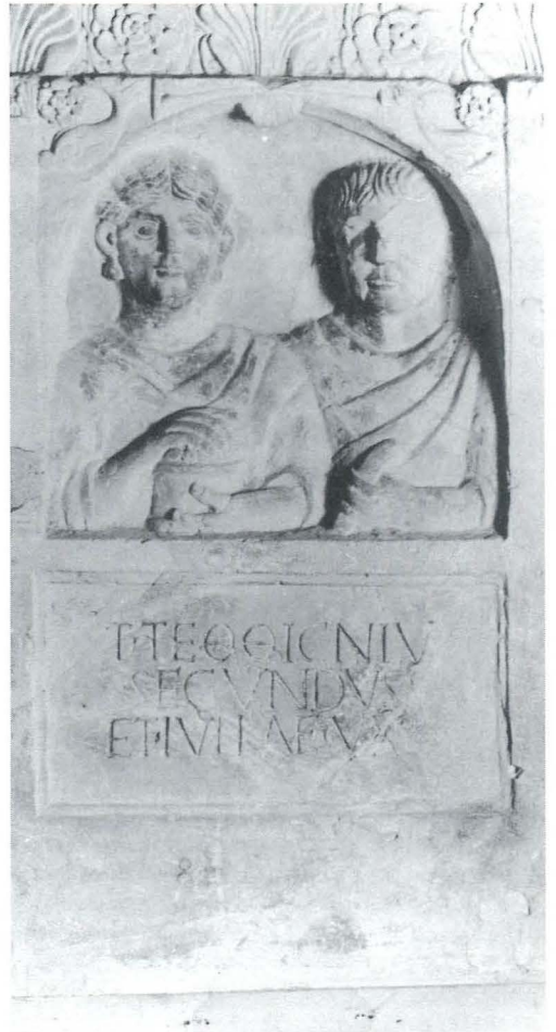
Monument de T. Teddicnius Secundus, Avignon, Musée Calvet