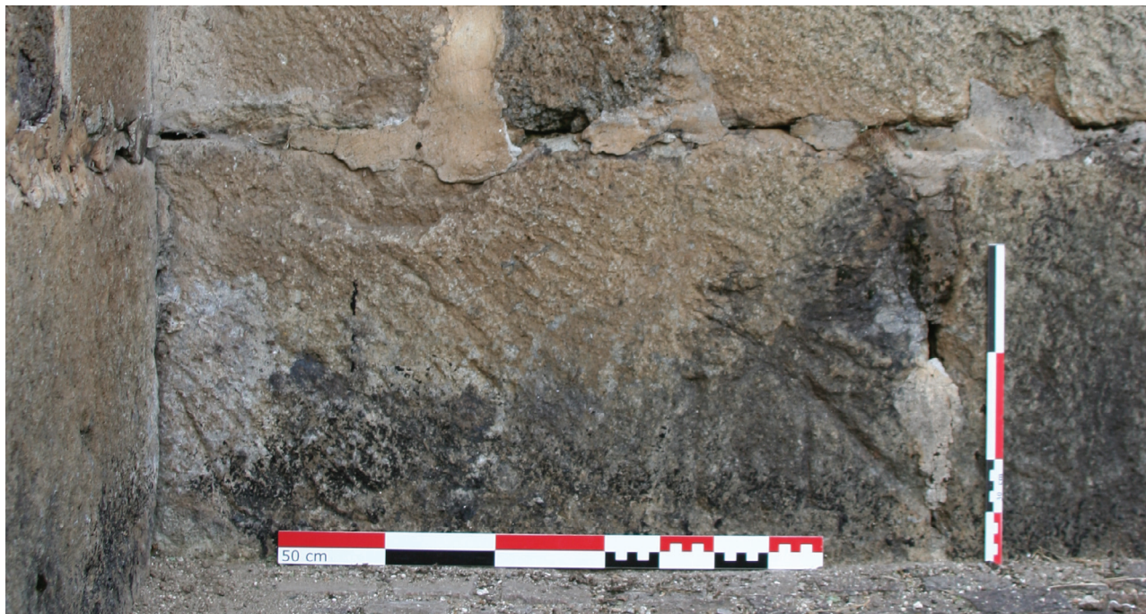
De haut en bas: relevé architectural partiel de la façade méridionale de l'église de Moussages (Cantal); photographie de l'inscription