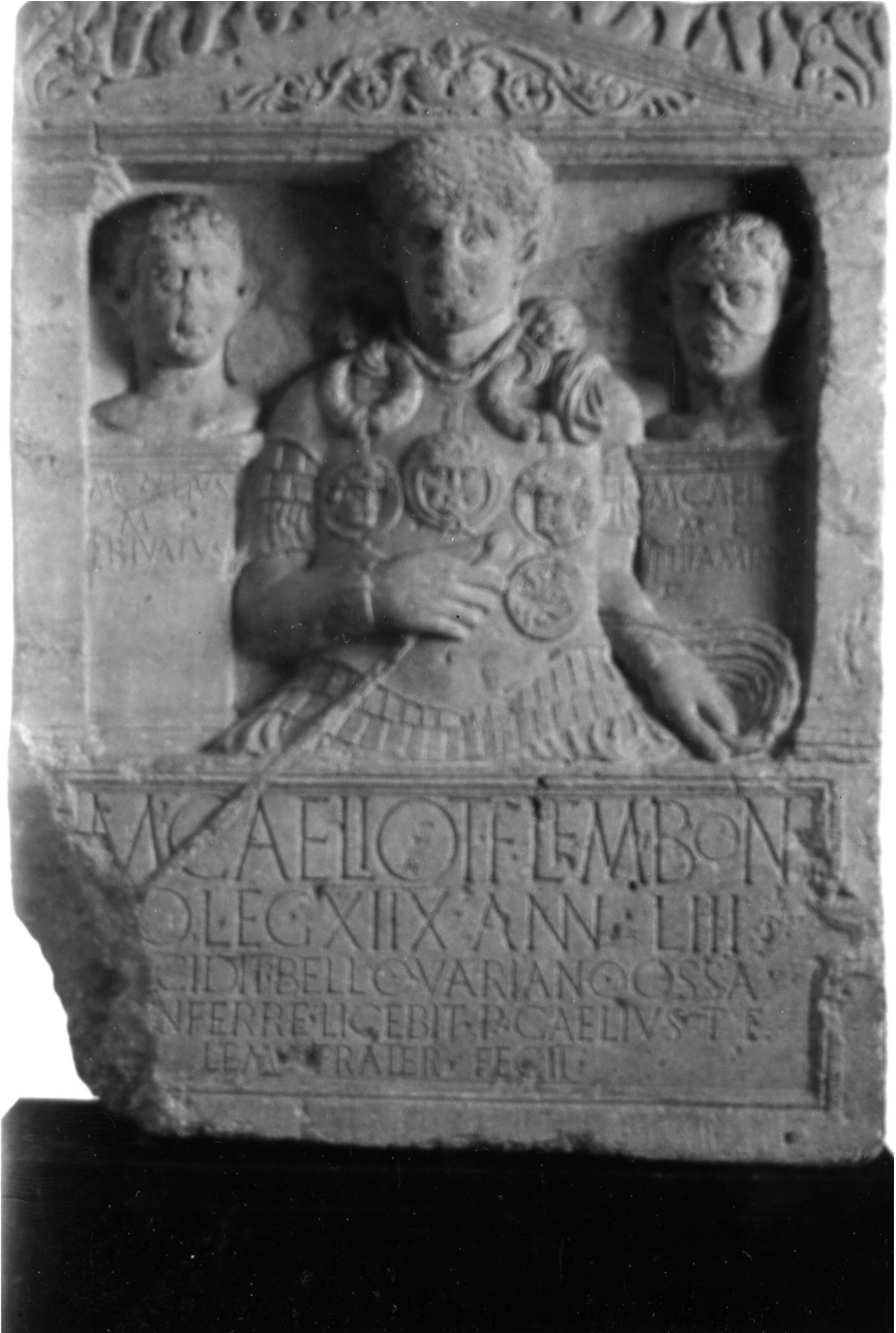
Fig. 1. Stèle funéraire épigraphique de M. Caelius, fils de Titus, centurion découverte vers 1630 à Fürstenberg (près de Castra Vetera = Xanten) (Calcaire lorrain : H. = 1,37 m x l. = 1,08 x Ép. = 0,28) (Rheinisches Landesmuseum, Bonn) (CIL, XIII, 8648 = ILS, 2244 ; Espérandieu, n° 6581 [t. 9])