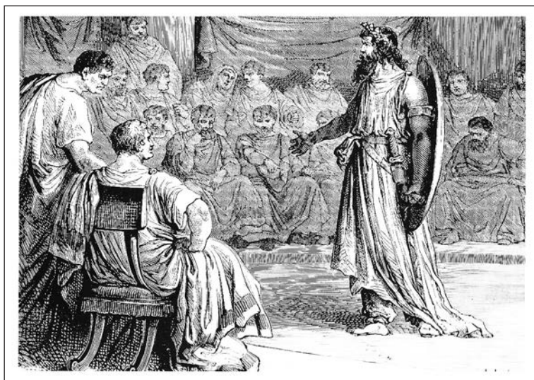
Fig. 1. Diviciacus devant le Sénat.