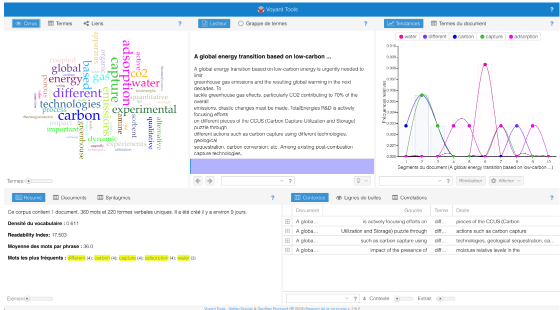
Annexe 3. Figure 3 : Test de l'outil Voyant