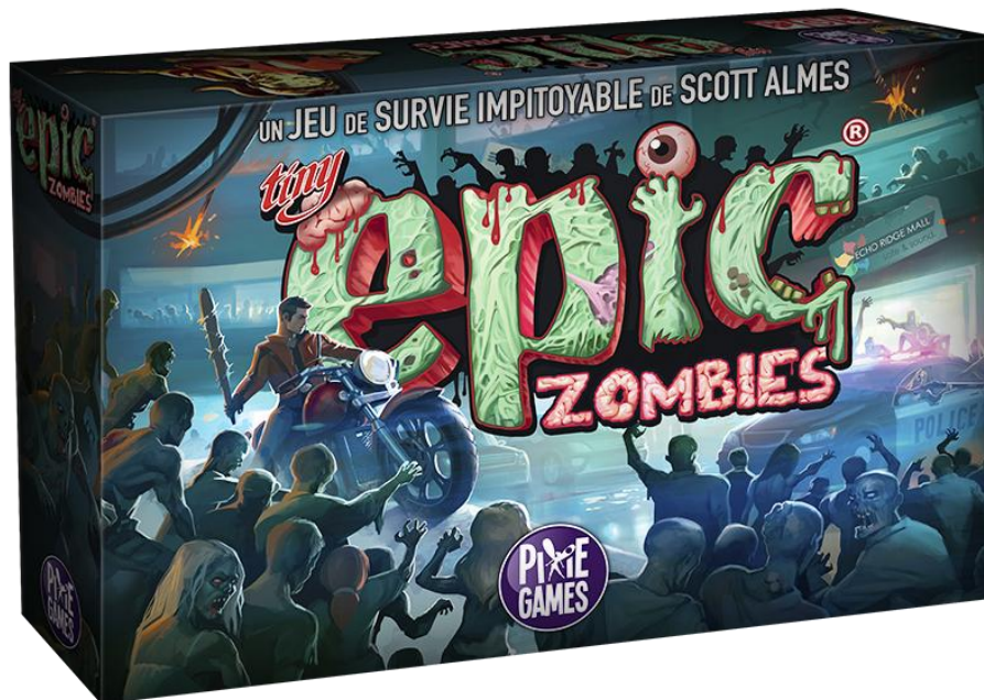
Figure 2. Boîte du jeu Tiny Epic Zombies.

Tiny Epic Zombies est un jeu de stratégie où les joueurs prennent le rôle de survivants poursuivis par des hordes de zombies dans un environnement postapocalyptique. Il se joue de 1 à 5 en 30 à 45 minutes. Il propose cinq modes de jeux : coopératif VS zombies, coopératif pur (les zombies sont gérés par une intelligence artificielle), compétitif VS zombies, ainsi que compétitif pur et solo 2 .