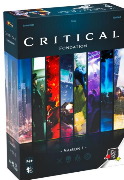
Figure 3. Boîte du jeu Critical Fondation – Saison 1.

Critical Fondation - saison 1 est un jeu de rôle sur table (ou JDR) futuriste se déroulant en 2033 et construit comme une série télévisée 3 . Ce JDR nécessite un maître du jeu qui accompagne les joueurs pour les plonger le plus facilement possible dans l'univers. Le jeu se base principalement sur l'utilisation de la communication orale ; les joueurs (entre 2 à 5) construisant leur histoire par le biais de leur personnage en fonction des compétences définies au préalable (lors de la phase de préparation du jeu). À noter qu'il s'agit d'un JDR d'initiation qui propose des sessions courtes (trente minutes).