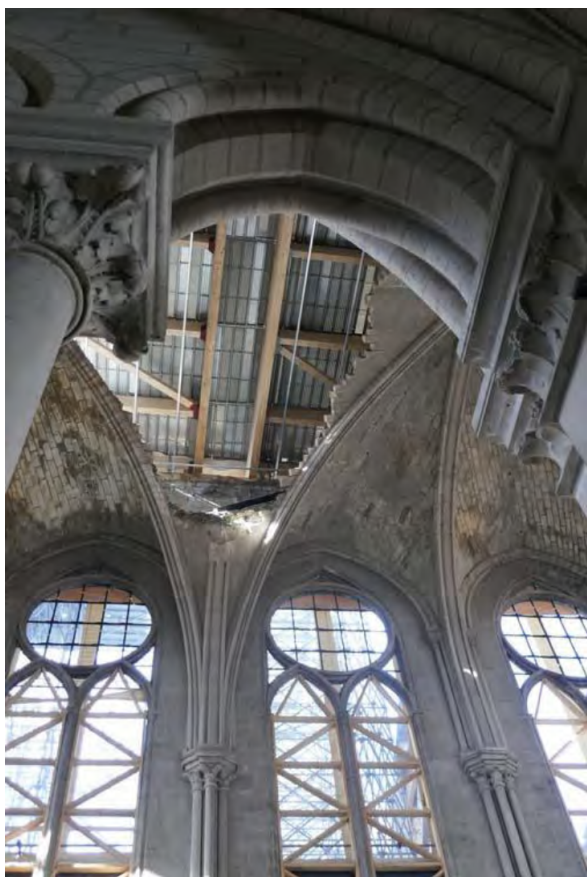
FIGURE 1 – Voûte de la nef NF3336

ciales, plutôt qu'un élément secondaire ou qu'un réceptacle passif de l'action. C'est ainsi que le monument et ses parties sont pensés comme des acteurs dans les événements et actions auxquels ils prennent part.