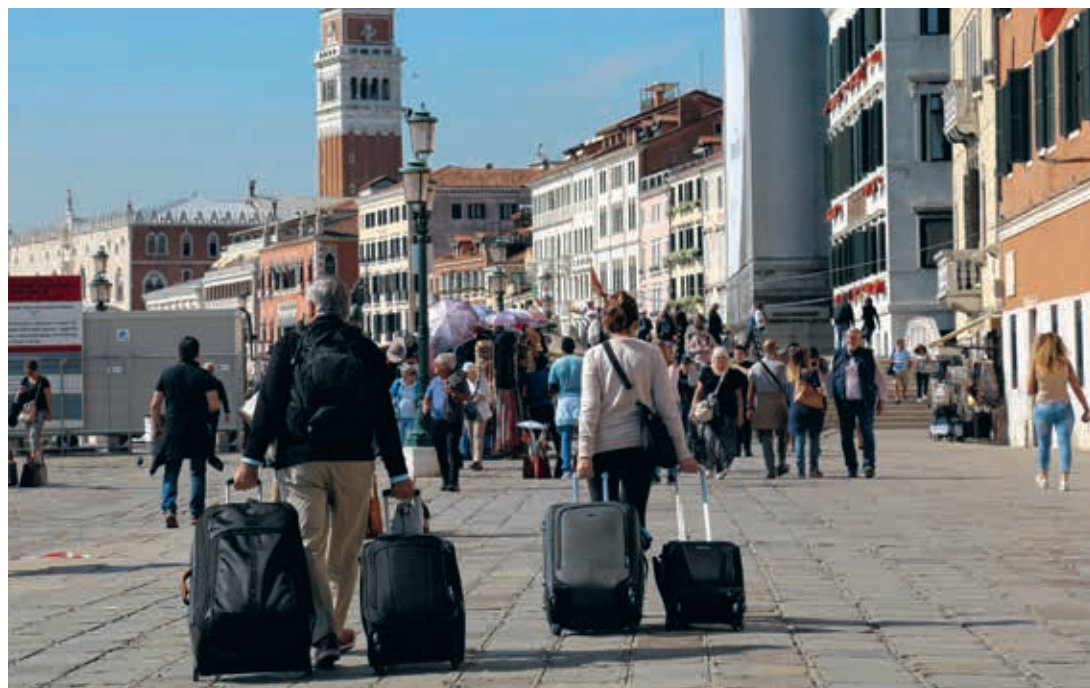
Les hordes de visiteurs, équipés de leurs valises à roulettes ou non, sont devenus une nuisance à Venise. La ville envisage d'en faire payer l'entrée.