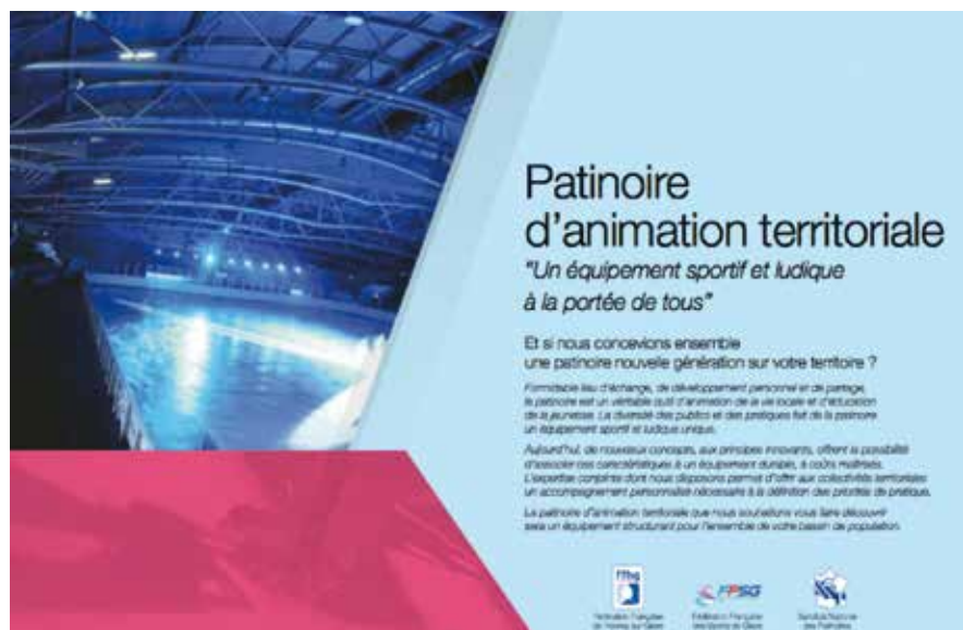
Annexe 2 : présentation synthétique des patinoires dans les métropoles

Annexe 1 : couverture de la brochure de communication à destination des collectivités territoriales, co-réalisée par la fédération française de hockey sur glace, la fédération française des sports de glace et le syndicat national des patinoires