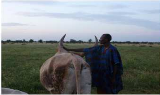
Photo d'interactions entre pasteurs et bovins