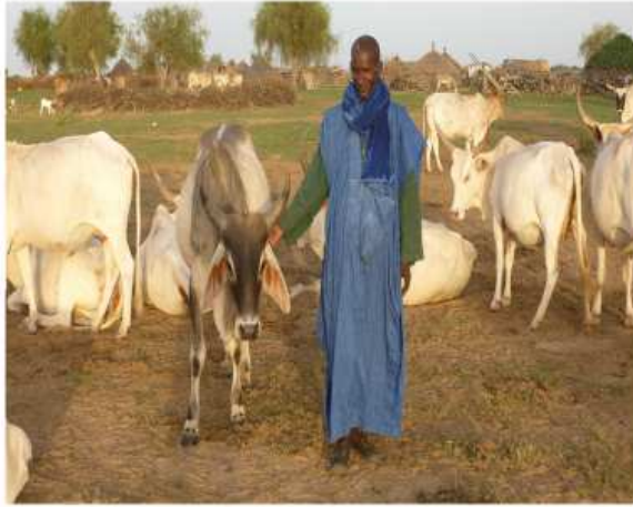
Photo de vaches Gobra et Guzerat

marcheuse, capacité métabolique à récupérer rapidement l'embonpoint en hivernage, bonne prolificité dans les conditions de vie locales).