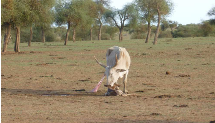
Photo de vaches ayant mis bas en brousse

Les vaches comme êtres conscients, actifs, intelligents au même titre que les hommes – comportement individuel et grégaire – et autonomes, une qualité selon les pasteurs (exemple les mises bas qui ne nécessitent pas d'être assistées).