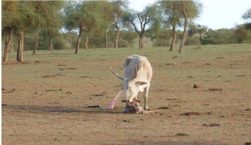
Photo de vaches ayant mis bas en brousse

Les vaches comme êtres conscients, actifs, intelligents au même titre que les hommes – comportement individuel et grégaire – et autonomes, une qualité selon les pasteurs (exemple les mises bas qui ne nécessitent pas d’être assistées).