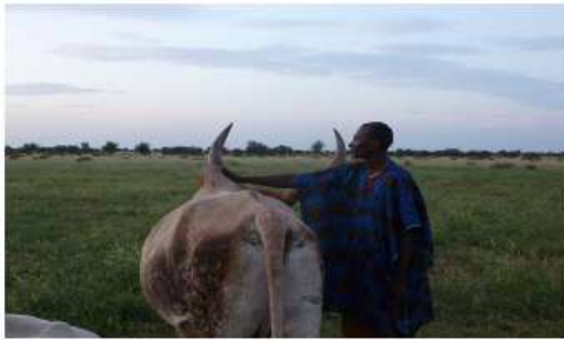
Photo d'interactions entre pasteurs et bovins