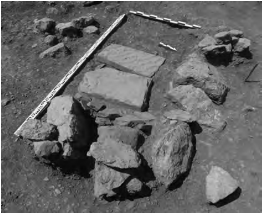
Рис. 3. Горзувиты-2018. Погребение 8