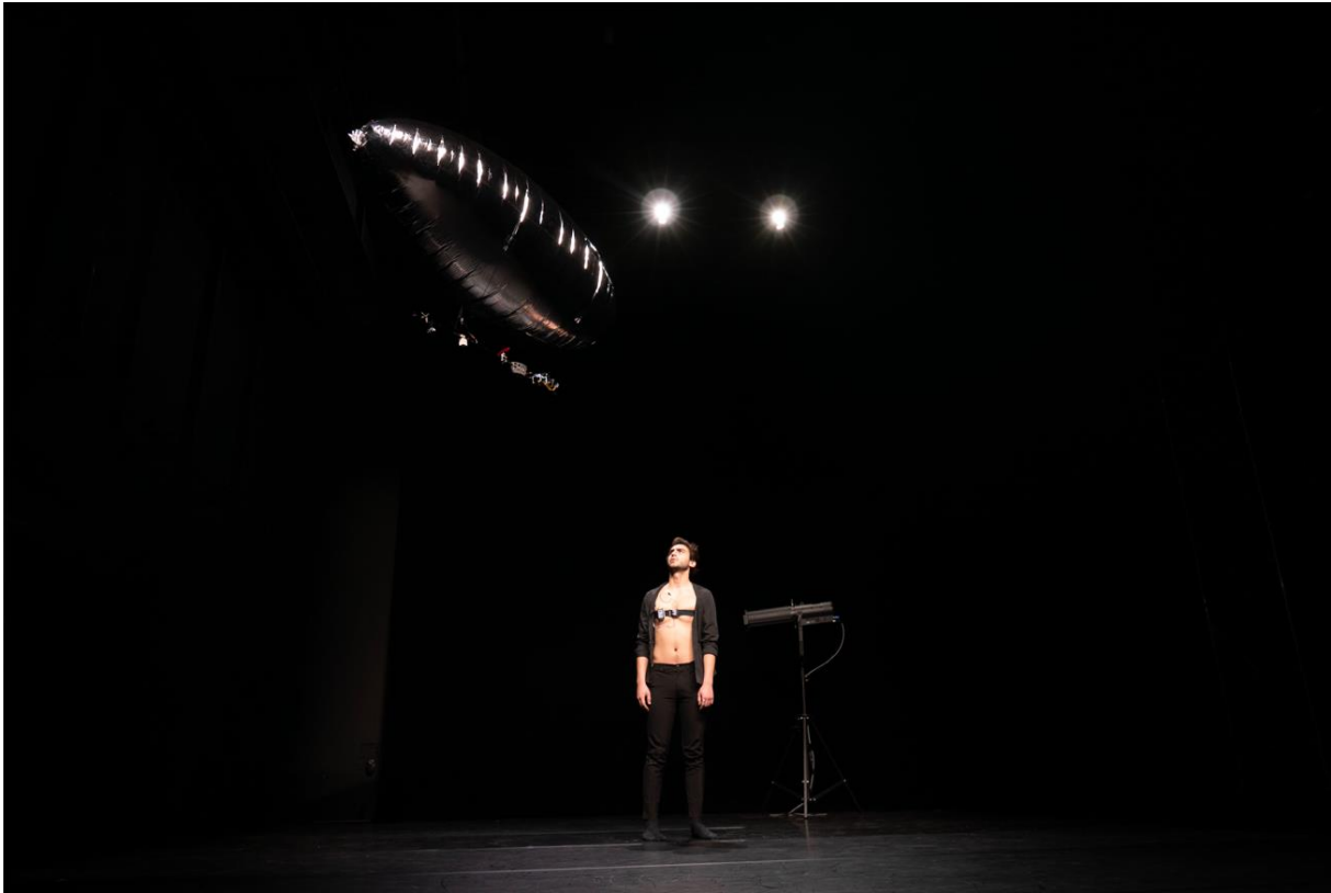
Figure 4. L'acteur en interaction avec le dirigeable lors d'une répétition au théâtre Antoine Vitez le 30 janvier 2024.

dimension confère à l'objet volant une identité et un caractère propres et pousse l'acteur à mieux considérer sa présence en tant que tel.