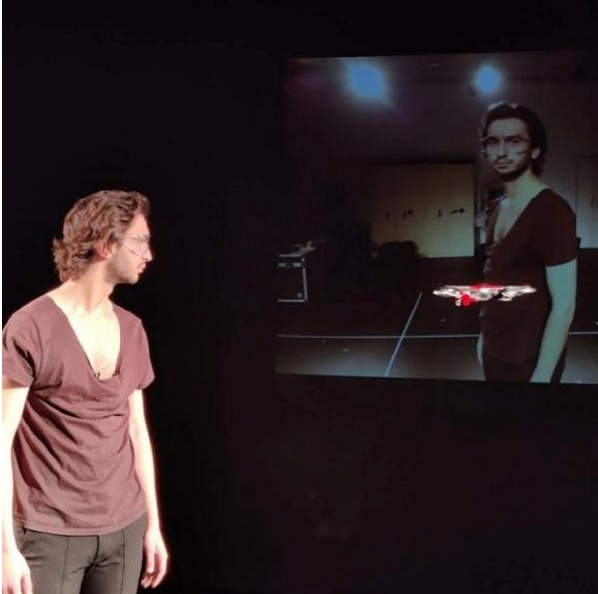
Figure 3. L'acteur filmé par le drone, projetant son image sur le mur du fond de la scène lors de la sortie de résidence au théâtre Antoine Vitez le 15 avril 2022.

Contrastant avec cette dynamique, le dirigeable, en raison de sa flottabilité et de son mode de propulsion souvent basé sur des changements thermiques, a un mouvement généralement plus lent et plus sensible à son environnement. Il peut dériver et changer de trajectoire de manière plus douce, offrant une présence aérienne plus paisible et contemplative (Voir Figure 4 ). Copiloté donc à la fois par ces variations et par les commandes envoyées par son pilote, il établit une liaison de regard potentiellement continue, mais qui reste toujours sujette à des altérations à chaque fois qu'un ou plusieurs de ces paramètres changent. Cela ajoute une dimension imprévisible à son interaction avec l'acteur. Notamment, une incertitude constante chez lui quant à la provenance des actions du dirigeable. Il ne peut jamais discerner avec certitude si une action particulière provient du pilote, de l'effet des courants d'air ou d'une combinaison des deux. Cette