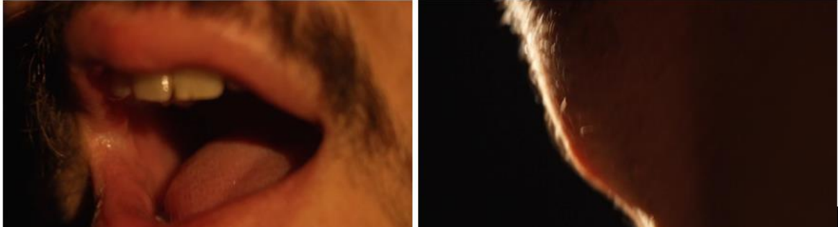
Figure 1. Gros plan sur la bouche et la glotte de l'acteur en train d'énoncer un texte poétique lors d'une sortie de résidence au bâtiment Turbulence d'Aix Marseille Université le 13 mars 2023.

En ce qui concerne la surface corporelle de l'acteur, un cadreur la filme de près, les images sont projetées en direct (Voir Figure 1 ). La projection dure environ quinze minutes. C'est un moment qui donne la parole au corps agi par la langue de Novarina tel que le filmage en témoigne.