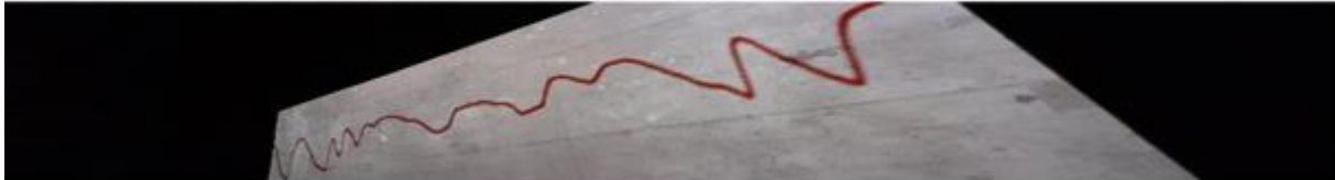
Figure 2. Captures d'écran issues de la représentation du 7 octobre 2022 au Vélo Théâtre. À gauche, l'acteur équipé de lunettes d'oculométrie. À droite, sa courbe respiratoire. En bas, la projection en temps réel de la courbe au sol.

Le dispositif Novabot confirme que cet espace de jeu, impulsé par la respiration, est essentiel au bon fonctionnement de la performance énonciative. L'acteur doit être conscient de cette intimité et être prêt à la partager pour que cela ait un impact. Tout dépend de la capacité de l'acteur à croire en ces forces souterraines, celles du travail du « déplacement du poétique », souvent considérées comme invisibles voire abstraites 3 .