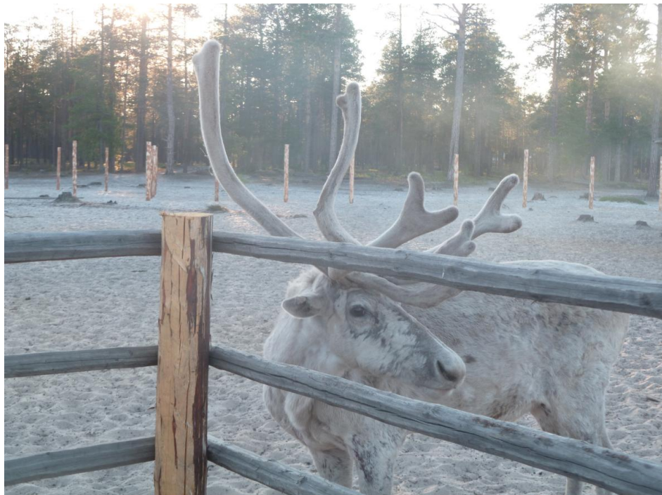
Малый Яр, Аган, 2013 ; © Д. СНдШ

чувствует это светлое начало... Он нас берет в свидетели: из глубин родной почвы разве не должен ли человек уметь подниматься в самый чистый эфир, открытое поле духа? Его интуитивное постижение смысла жизни свойственно тем людям, держащим в себе свет, иногда неосознанно, который они возвращают нам хоть на одну книгу и который еще освещает тьму души, когда мы закрыли книгу.