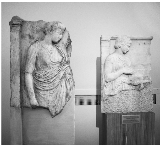
Fig. 4 – Deux stèles semblables et contemporaines du Musée national archéologique d'Athènes montrent que les sculpteurs n'ont pas toujours le même rapport au cadre : MNA 2670 et 1858 (vers 420-400 av. J.-C.).

Ces exemples, isolés du reste de la production de stèles funéraires archaïques 27 , mettent en lumière les liens étroits existant, dès le début de la maîtrise de la sculpture de la pierre, entre le cadre (le fond du relief) et les figures qu'il accueille. Nous avons vu que cette relation s'observe également, à la même période, mais d'une tout autre manière, dans les premiers frontons sculptés.