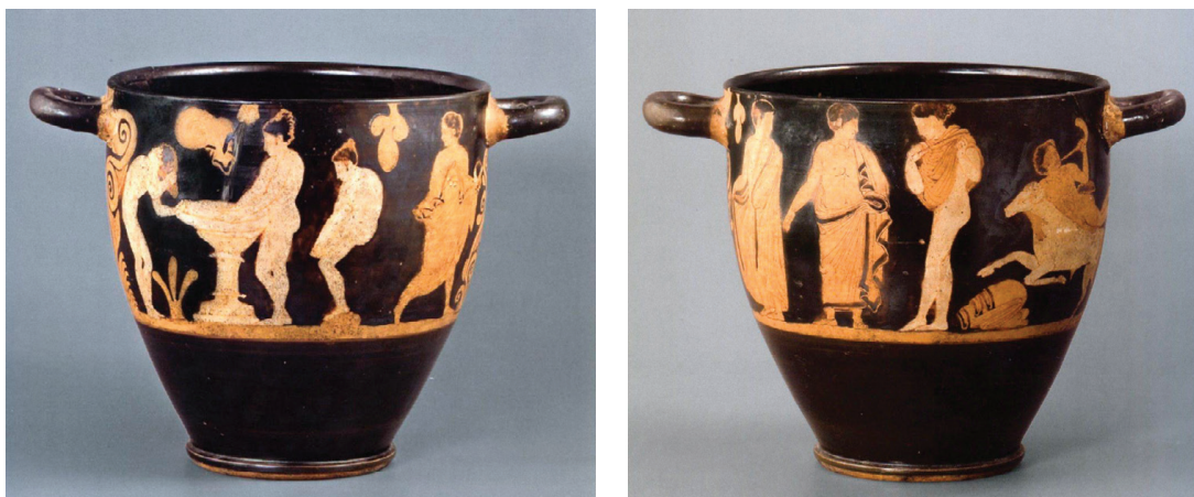
Fig. 6-7 – Skyphos falisque à figures rouges. Saint-Pétersbourg, Musée de l'Ermitage (cliché : © The State Hermitage Museum. Photo by Alexander Lavrentyev).