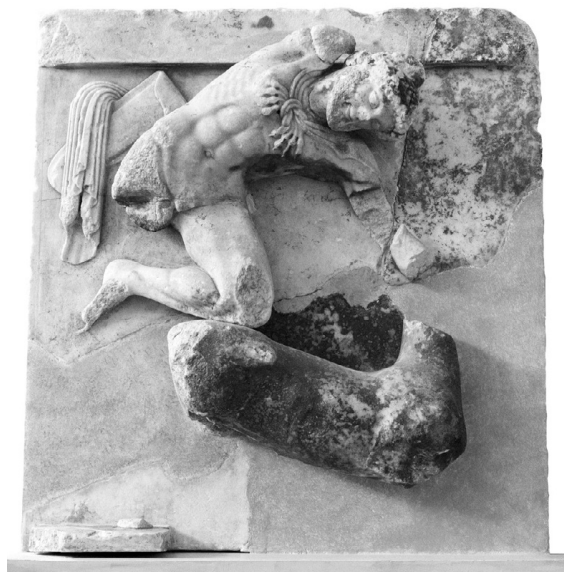
Fig. 3 – Métope du trésor des Athéniens. Delphes, musée archéologique.