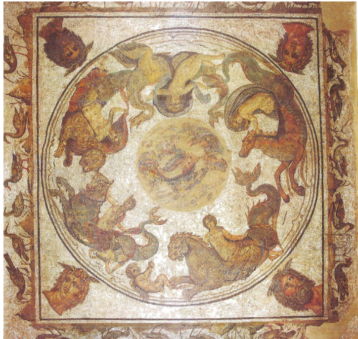
Fig. 23 – La traversée heureuse de Léandre, Dougga. Tunis, musée du Bardo (d'après M. YACOUB, 1995, fig. 82, p. 167).

On observe cinq unités. En partant de la bordure vers le centre du pavement, se succèdent les têtes d'Océan, les Bacchantes, les Saisons, les Génies et enfin le Génie de l'Année dans son médaillon.