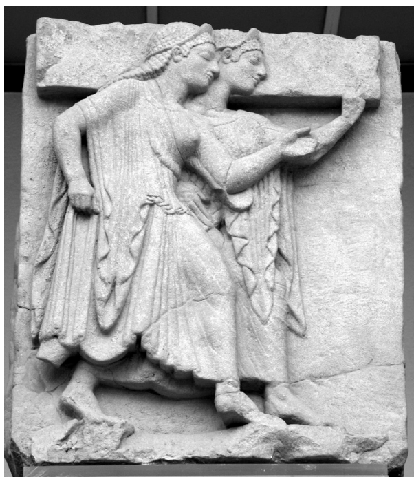
Fig. 2 – Métope du Temple majeur, Héraion du Sele. Musée archéologique national de Paestum.

elles, figurent des danseuses se dirigeant vers la droite (fig. 2). La scène est d'ordinaire interprétée comme la représentation d'une danse rituelle menée par la coryphée que l'on peut reconnaître sur une métope figurant une seule femme se dirigeant vers la droite mais tournant la tête vers l'arrière 19 .