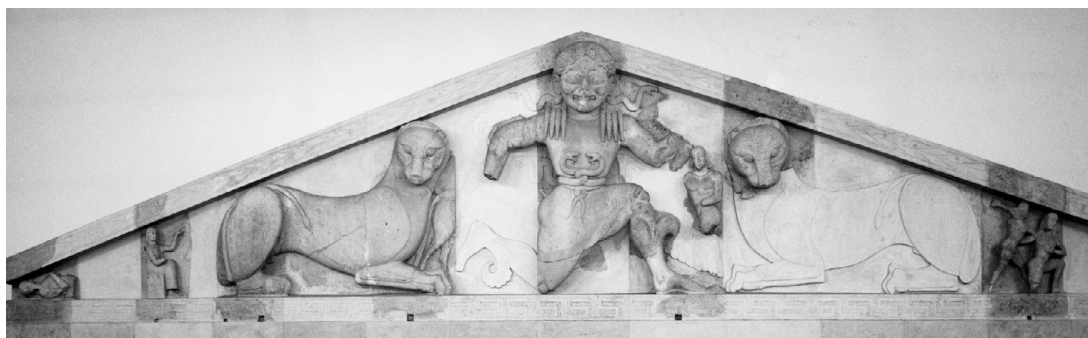
Fig. 1 – Fronton ouest du temple d'Artémis à Corfou. Musée archéologique de Corfou.

sur la sima rampante. Deux fauves couchés sont disposés symétriquement de part et d'autre de la scène centrale; viennent enfin des dieux et des géants, dont les jambes serpentiformes s'adaptent parfaitement aux angles du fronton, en une formule appelée à être reprise.