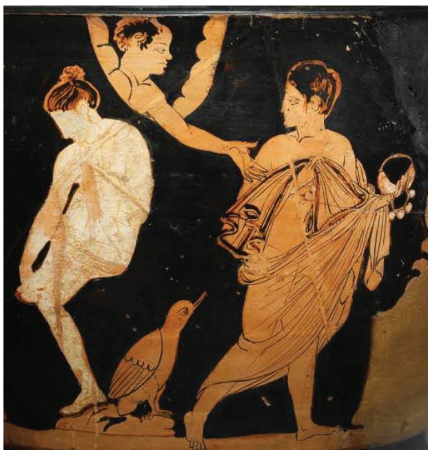
Fig. 10 – Skyphos falisque à figures rouges, détail. Paris, musée du Louvre, département des Antiquités grecques, étrusques et romaines.

à l'image. Les deux personnages semblent échanger un regard, signe que l'homme a conscience de l'apparition 58 .