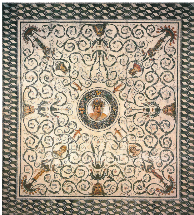
Fig. 22 – Mosaïque du Génie de l'Année et les quatre Saisons, El Jem. Tunis, musée du Bardo (d'après M. BLANCHARD-LEMÉE et al. 1995, fig. 17-18, p. 42-43).

comme l'ordonnateur de celle-ci. Immuable sur son char, il assure la continuité et la pérennité des quatre Saisons et, par là même, des travaux agricoles qui accompagnent chacune d'elles. Régulateur des eaux marines et des eaux douces qui fécondent les terres labourées, le dieu marin est honoré, simultanément, par les pêcheurs et les laboureurs.