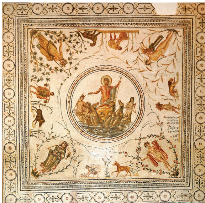
Fig. 21 – Mosaïque de Neptune et les Saisons, La Chebba. Tunis, musée du Bardo.

de complexité supérieur. Quatre paires de figures représentant un homme et un animal, disposés en croix, forment deux axes : l'un vertical l'autre horizontal. Chaque figure de la paire est séparée par une plante, roseau, rosier, vigne, etc. Ces végétaux ont la même épaisseur et la même finesse que celles des tiges en rinceaux et du fait de leur courbe induisent un mouvement en direction des rinceaux qui entourent les figures en pied sans pour autant les rejoindre, introduisant à leur tour une autre tension visuelle. Elles suggèrent l'existence de cadres réunissant un animal et un personnage de part et d'autre de chacune des figures, revêtues d'attributs symboliques, inscrites dans une mandorle, invitant à lire la composition comme un ensemble dont chaque angle serait autonomisé. Ce mode de lecture entre en tension avec le précédent : la liaison visuelle entre les mandorles et le médaillon central.