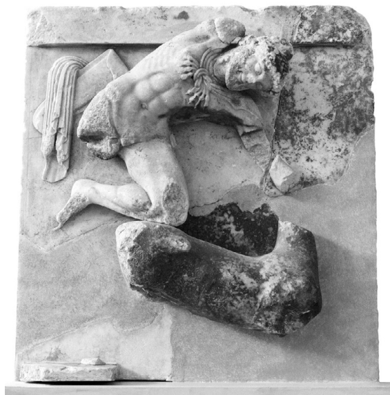
Fig. 3 – Métope du trésor des Athéniens. Delphes, musée archéologique.