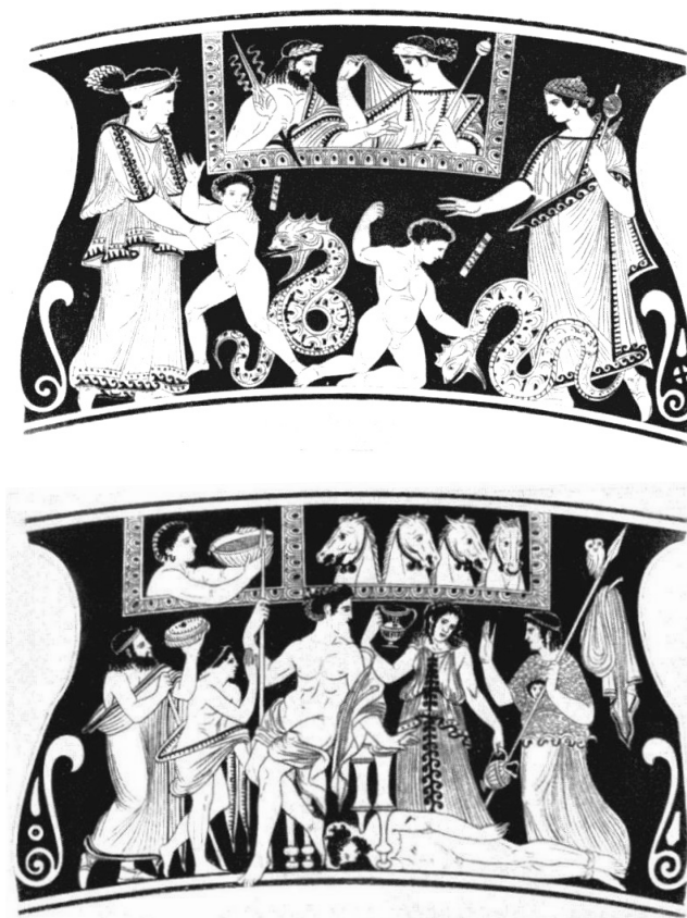
Fig. 11-12 – Peintre de Settecami, stamnos à figures rouges. Florence, musée archéologique national (d'après BEAZLEY 1947).

Notons par ailleurs que les antécédents de l'introduction de figures en buste à l'arrière-plan sont certainement à chercher dans la céramique italote et notamment paestane. Il est probable que, comme pour d'autres aspects de la céramique italote, les peintres de vases falisques ont été l'un des relais dans la transmission de ce motif en Italie centrale et en particulier dans l'imagerie étrusque 61 . On sait en effet la prédilection des peintres de vases paestans, à commencer par Astéas et Python, pour les dieux, satyres ou furies qui surgissent dans la partie supérieure de l'image 62 . Ces figures apparaissent en général comme des témoins de la scène représentée au centre, au premier plan de l'image, sans intervenir elles-mêmes; on ne voit d'elles que le buste, dissimulées derrière ce qui pourrait apparaître comme un repli de terrain, marqué par une ligne blanche continue ou pointillée 63 . Il arrive aussi que des furies, à l'image du satyre sur le skyphos, tendent les bras vers les