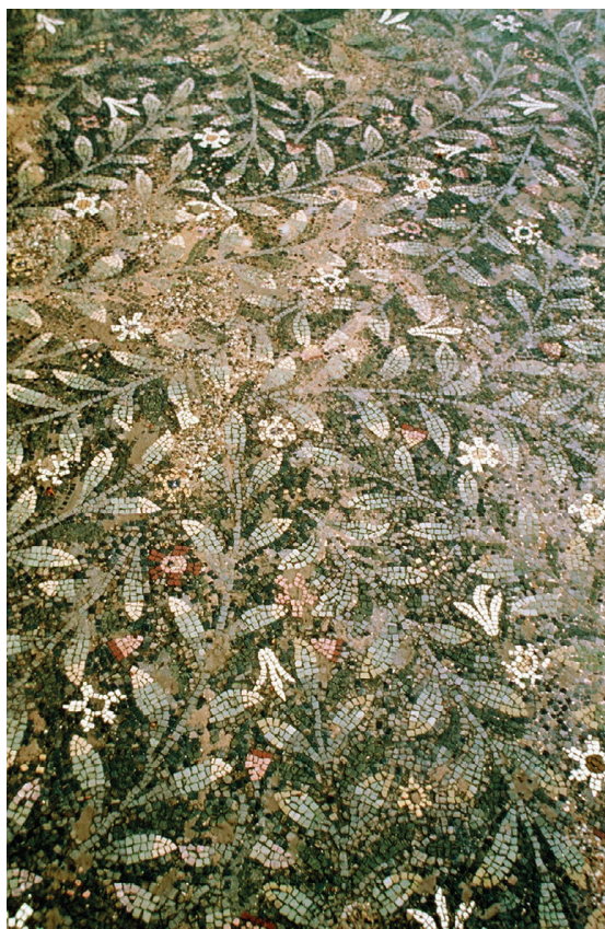
Fig. 19 – Mosaïque de la Jonchée, Cherchel. Parc de la mosaïque.

d'autres cas à l'utilisation d'un grand thème populaire, mais elle est toujours portée par un langage pictural singulier qui s'exprime par un travail subtil de surface où le cadre joue un rôle fondamental, à l'exception d'une œuvre, un unicum jusqu'à présent : la mosaïque de la Jonchée de Cherchel (fig. 19) qui figure un amas de branches feuillues parsemé de fleurs. On sait que le cadre a pour fonction d'autonomiser l'image qu'il enferme par rapport à son environnement, nous permettant par exemple de voir une marine accrochée sur une tapisserie de fleurs sans y percevoir d'incongruité. La mosaïque de la Jonchée présente une particularité singulière qui la distingue des autres pavements : elle n'est pas délimitée par un cadre mais par les murs de l'espace qu'elle décore. Par cet artifice, le pictor de la Jonchée joue du rapport à l'espace architectural en conviant l'observateur à confondre l'espace pictural et l'espace réel. Il va plus loin en suggérant qu'il a figuré une portion de nature qui se prolonge au-delà des murs de la pièce, immergeant ainsi l'observateur dans un espace imaginaire.