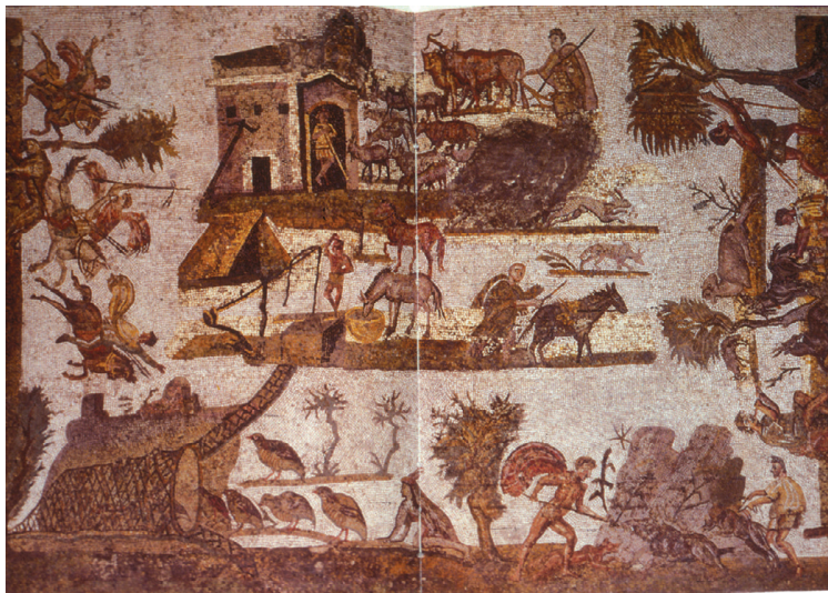
Fig. 25 – Scènes de la vie rurale, Oudna. Tunis, musée du Bardo (d'après M. BLANCHARD-LEMÉE et al., 1995, fig. 125, p. 174-175).

la mosaïque qui décorait l'une des cours d'une vaste domus à Oudna 107 (fig. 25) en Tunisie, elle aussi doublée d'une colonnade. La frise se déroule sur trois côtés et entoure comme une bordure, mais sans cadre, un domaine rural dont elle révèle les différentes activités en soulignant, par la continuité de la terre qui sert de support à la frise marginale, l'unité d'un parcours. On y découvre les champs où l'on cultive les olives, les rochers où l'on garde les chèvres, plus loin les forêts où l'on chasse les sangliers et les clairières où l'on tend les filets pour attraper les perdrix, alors que la ferme, quand on s'en approche, nous laisse découvrir les champs retournés par les charrues, les puits, la bergerie, et plus loin la plaine aride où l'on chasse les fauves.