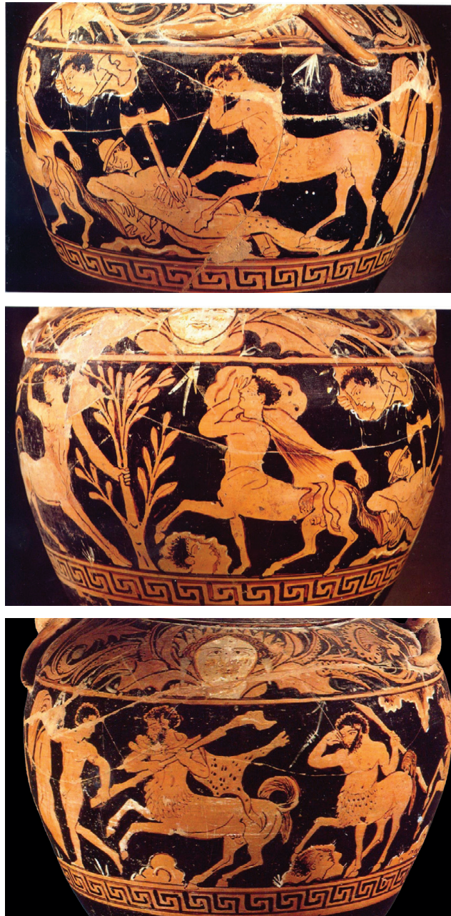
Fig. 14-16 – Peintre de la Centauromachie, amphore à figures rouges. Florence, musée archéologique national (cliché : d'après MARTELLI 1987).

Le skyphos du Louvre se distingue de ces images et des précédents italiotes par le traitement original de l'espace, le fond semblant se déchirer ou du moins s'ouvrir. L'ouverture est soulignée par des renflements qui pourraient passer pour des nuées. Ce procédé se retrouve sur quelques autres images étrusques, qui confirment l'importance nouvelle accordée à l'arrière-plan du champ figuré. Sur ces documents, qui représentent des scènes de bataille et de mise à mort, le nouvel espace qui s'ouvre au fond de l'image n'est plus un espace dionysiaque ou génériquement divin, mais l'au-delà