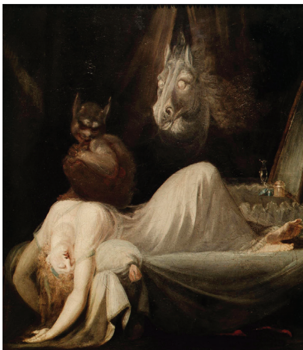
Fig. 5 – J. H. Füssli, Le Cauchemar .

Freies Deutsches Hochstift / Frankfurter Goethe-Museum (cliché : © David Hall).