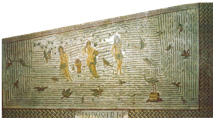
Fig. 24 – Vénus accompagnée de deux Nymphes, Oudna. Tunis, musée du Bardo (d'après M. YACOUB 1995, fig. 100, p. 191).

se déploient sur trois côtés en formant un « U » qui encadre le tableau central, lui-même constitué d'ondes aquatiques horizontales sur lesquelles sont représentées les trois divinités.