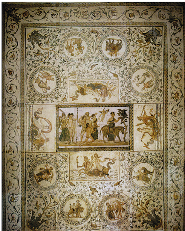
Fig. 26 – Mosaïque du Silène à l'âne, El Jem. Musée archéologique d'El Jem (d'après M. YACOUB, 1995, fig. 17a p. 60).

distance qui sépare les limites du domaine. Les topia retenus y concourent : les prairies ne peuvent pas être proches des déserts habités de bêtes sauvages. Le regard sur la mosaïque confirme ce que l'esprit laisse deviner : ce domaine est immense.