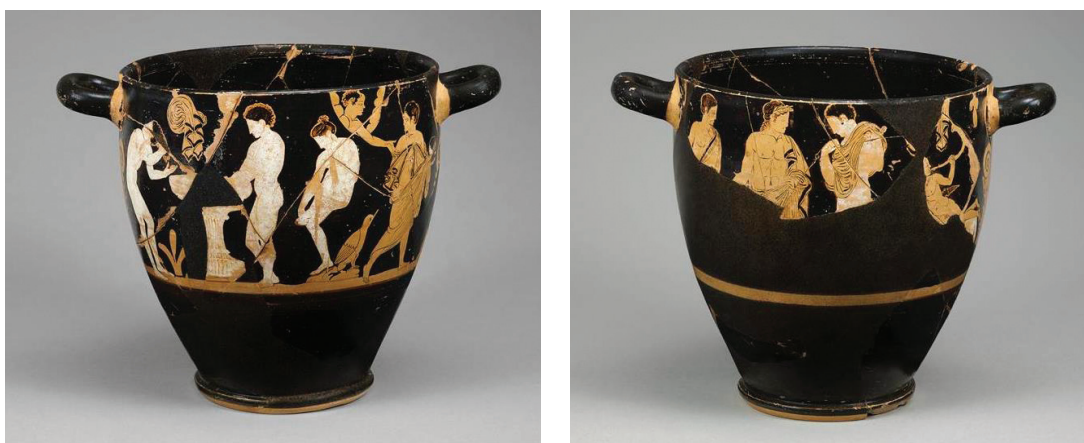
Fig. 8-9 – Skyphos falisque à figures rouges. Paris, musée du Louvre, département des Antiquités grecques, étrusques et romaines.

Ce vase trouve une quasi-réplique (un remake ) dans un vase du musée du Louvre, qui a fait partie lui aussi de la collection Campana 56 . Les dimensions sont les mêmes 57 , et le décor est comparable, avec la même disposition des figures (fig. 8-9). Quelques éléments varient toutefois. Outre l’agencement des éléments secondaires (feuilles de vigne et vêtements accrochés), qui ne sont pas tous placés au même endroit sur les deux vases, un changement important intervient dans la scène du bain. Là où une feuille de vigne occupait l’espace entre le dos de la baigneuse de droite et le personnage masculin s’éloignant, le vase du Louvre introduit une figure supplémentaire (fig. 10). Le nez, la chevelure et surtout l’oreille (dressée, comme celles du cheval de Füssli) indiquent qu’il s’agit d’un satyre. Son visage et une partie du buste apparaissent dans une sorte d’ouverture sur le fond noir, matérialisée par des demi-cercles. Le satyre sort le bras, qu’il tend vers la figure masculine, pour le toucher ; de fait, sa main passe au premier plan, instituant ainsi une profondeur troublante