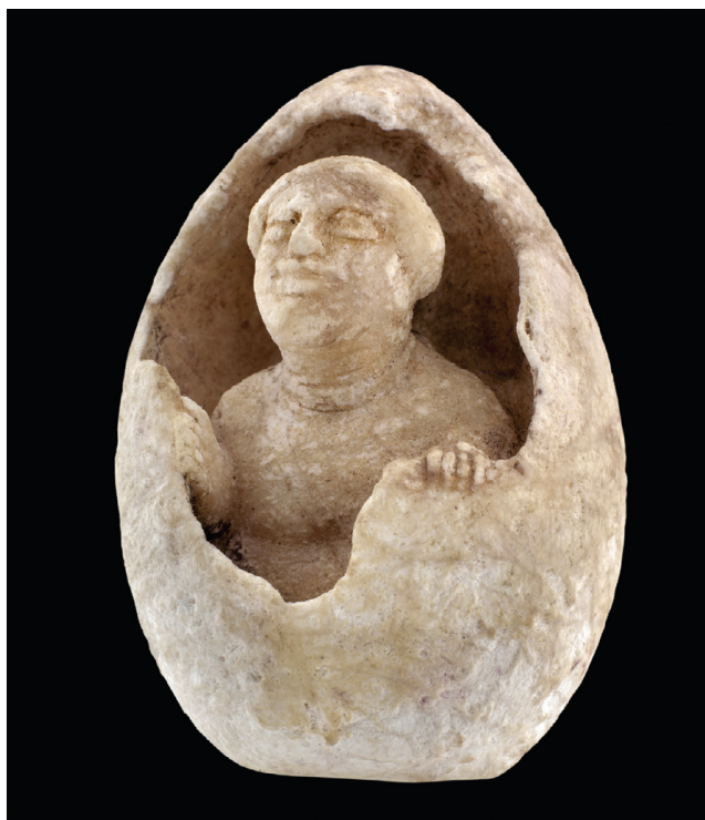
Fig. 18 – Hélène sortant de l'œuf. Métaponte, musée archéologique national (cliché : su concessione del Ministero dei Beni e delle Attività Culturali – Direzione Generale Musei – Polo Museale Regionale della Basilicata ; reproduction interdite).

comme des nuages enveloppant la bataille et signifiant l'approche de la mort 83 . La confirmation de cette interprétation est donnée par une figure de démon féminin ailé, qui surgit d'un de ces nuages (fig. 17). Elle surplombe une Amazone tombée à terre qu'un Grec saisit aux cheveux et s'apprête à achever d'un coup d'épée; figure spéculaire des spectateurs que nous sommes, le démon semble observer passivement la scène, les deux mains posées sur le rebord du nuage 84 . Mais l'impassibilité du démon est trompeuse : elle attend que la guerrière succombe pour s'emparer d'elle.