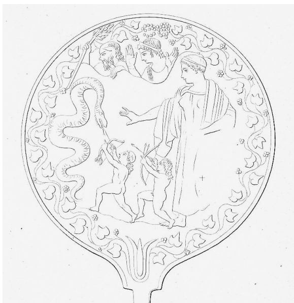
Fig. 13 – Miroir. Rome, musée national étrusque de Villa Giulia (cliché : © Universitätsbibliothek Heidelberg, E. Gerhard, Etruskische Spiegel , IV, pl. CCXCI, A).

personnages de la scène principale, établissant ainsi une sorte de contact avec eux 64 . Ces dispositifs se retrouvent sur un certain nombre d'images étrusques, qui se ressentent de l'influence méridionale. C'est le cas d'un stamnos étrusque à figures rouges, vase éponyme du Peintre de Settecami. Les fenêtres ouvertes au centre de la scène sont la transposition la plus nette du motif des ouvertures paestanes 65 : sur la première face apparaissent Tinia et Uni (fig. 11), sur l'autre face un personnage masculin dont le bras, là aussi, déborde le cadre et entre dans l'image principale, ainsi que les quatre chevaux d'un quadriges dont, comme sur le tableau de Füssli, seules émergent les têtes (fig. 12) 66 . D'autres images reprennent la simple ligne continue, comme un miroir découvert à Cerveteri représentant Aplu et Artumes face au serpent Python (fig. 13) ; dans la partie supérieure figurent un satyre et un personnage féminin, sans doute une ménade 67 . Comme sur une amphore de Capoue 68 , la main du satyre est posée sur la ligne continue et le bâton qu'il tient entre dans la scène principale. Plusieurs autres miroirs représentent volontiers un personnage dans la partie supérieure, solution efficace de remplissage du sommet arrondi du champ figuré 69 .