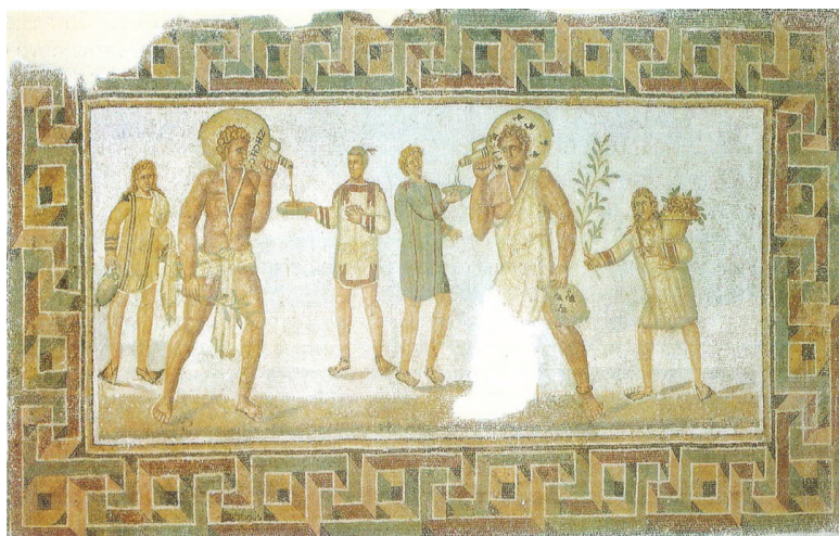
Fig. 20 – Mosaïque des Échansons, Dougga. Tunis, musée du Bardo (d'après M. YACOB, 1995, fig. 125 p. 242).

opposée de ce même point d'observation, le motif perd de son relief. C'est donc en marchant le long du pavement que le motif se présente en axonométrie et prend toute son amplitude, selon une succession de points de vue. À l'angle de la mosaïque, l'introduction de la diagonale dans le motif géométrique assure le changement d'orientation ; l'emploi de la diagonale est un procédé courant des mosaïstes pour masquer l'interruption visuelle.