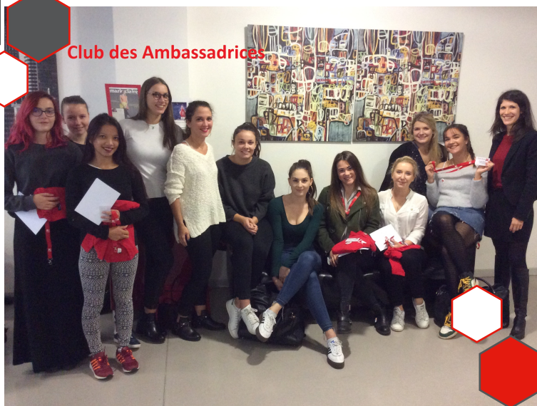
Club des Ambassadrices

11 ambassadrices constituent notre « Club des Ambassadeurs ». Elles représentent donc chacune leur formation !