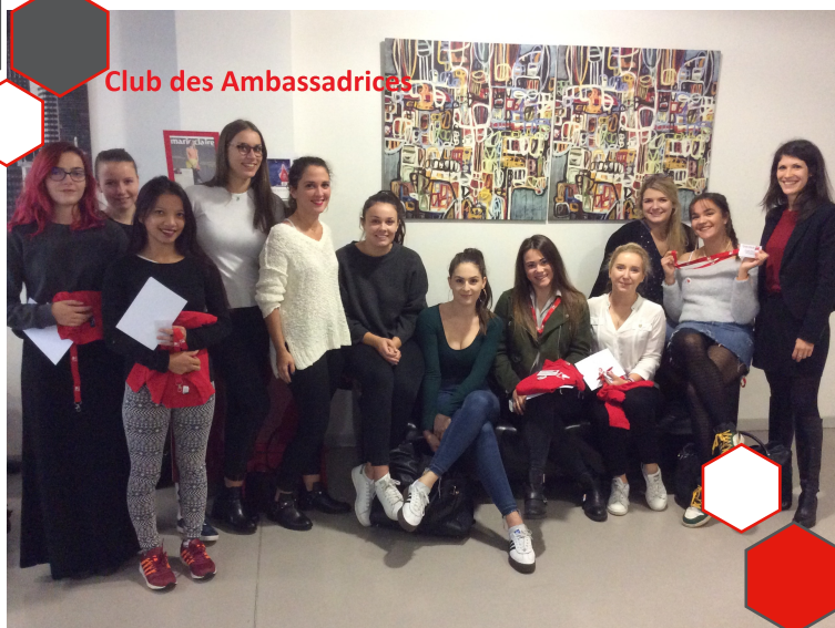
Club des Ambassadrices

11 ambassadrices constituent notre « Club des Ambassadeurs ». Elles représentent donc chacune leur formation !