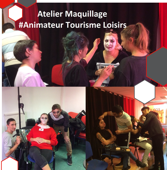
Atelier Maquillage #Animateur Tourisme Loisirs

Bientôt la cérémonie de remise de diplômes aura lieu : RDV le 27 novembre pour fêter la réussite des étudiants !