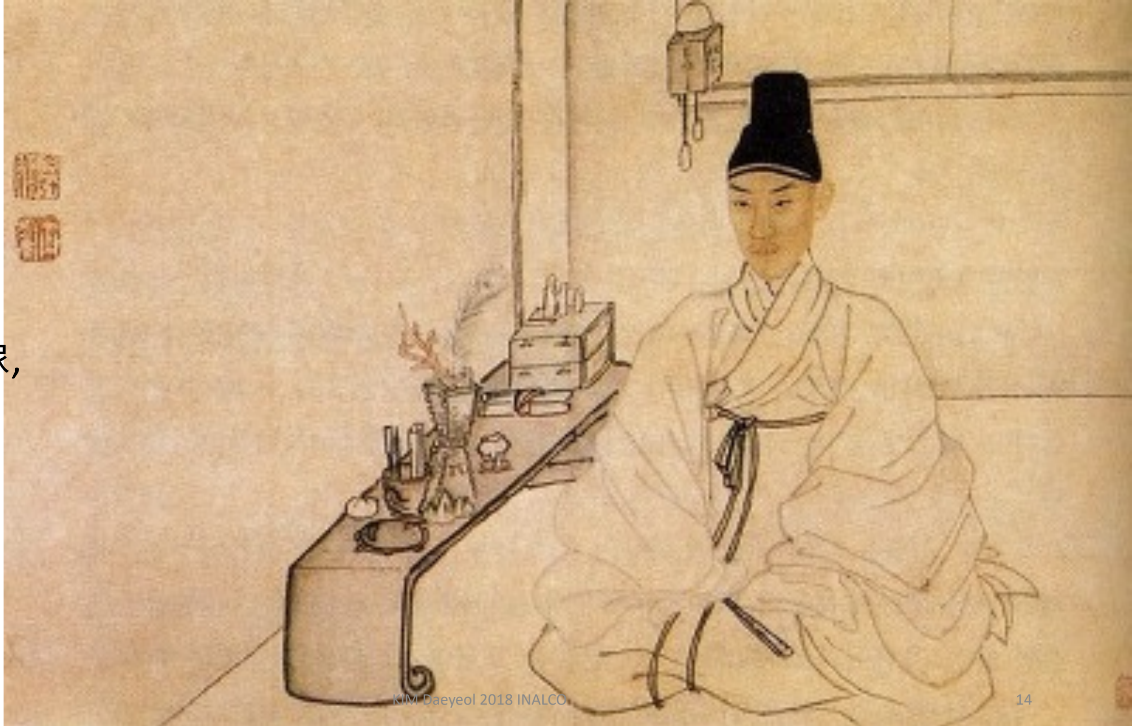
金弘道, 士人肖像, 18 e s.