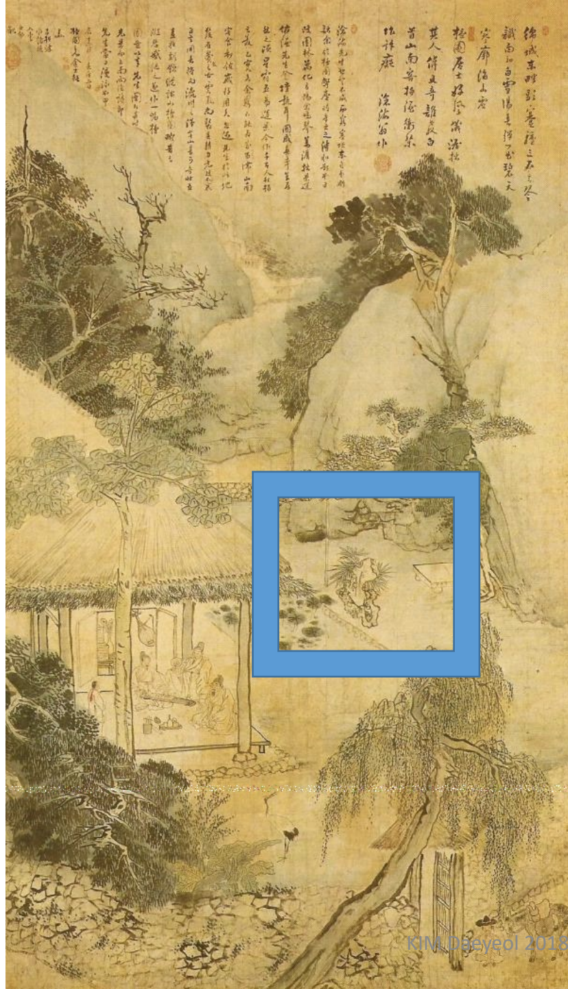
金弘道, 檀園圖 (단원도) 1784