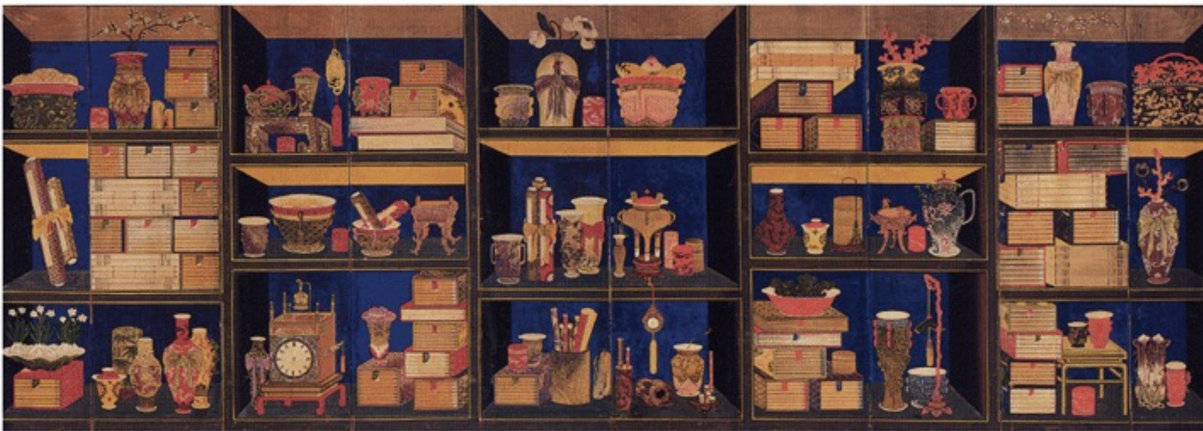
작자미상, <책가도(冊架圖)>, 19세기, 비단에 채색, 198.8× 39.3cm, 국립중앙박물관