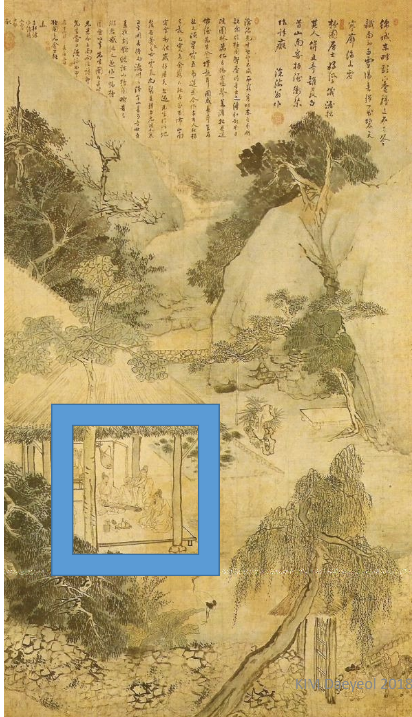
金弘道, 檀園圖 (단원도) 1784