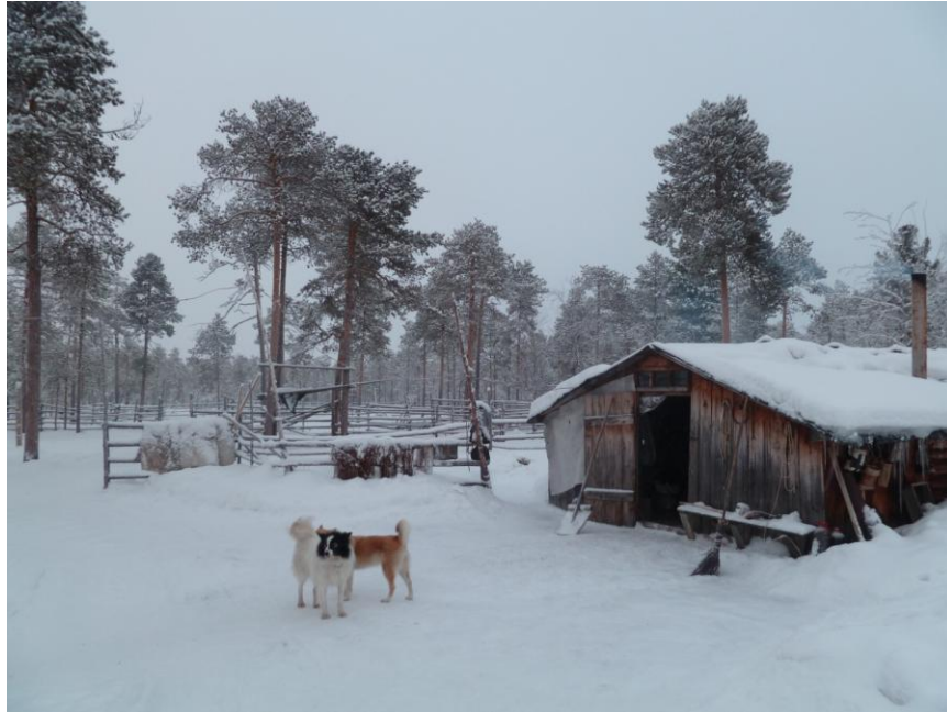
Figure n° 6 : Campement d'automne

La plupart de ceux qui mènent encore un mode de vie traditionnel ( традиционщики ) sont reliés à la terre « avec » laquelle ils vivent, non seulement par des liens physiques, mais aussi mentaux, émotionnels et spirituels. Mais à la tête depuis mai 2021, et ce pour deux ans, du Conseil de l'Arctique 56 , la Russie a officialisé sa nouvelle bataille : « Lomonossov a dit que la Russie grandirait par la Sibérie. Au cours des prochaines décennies, la Russie va grandir par l'Arctique et les territoires du Nord. Ce sont des choses assez évidentes ». Le rêve de l'écrivain Youri Rytkhéou de voir, dans un avenir suffisamment proche, la neige retrouver sa blancheur sur tout le littoral de la toundra et l'homme du Nord se sentir le maître réel de son existence, si fragile et palpitante dans cette contrée des froids longs et sévères 57 , s'éloigne une fois encore. L'expansion industrielle est une troisième forme de conquête.