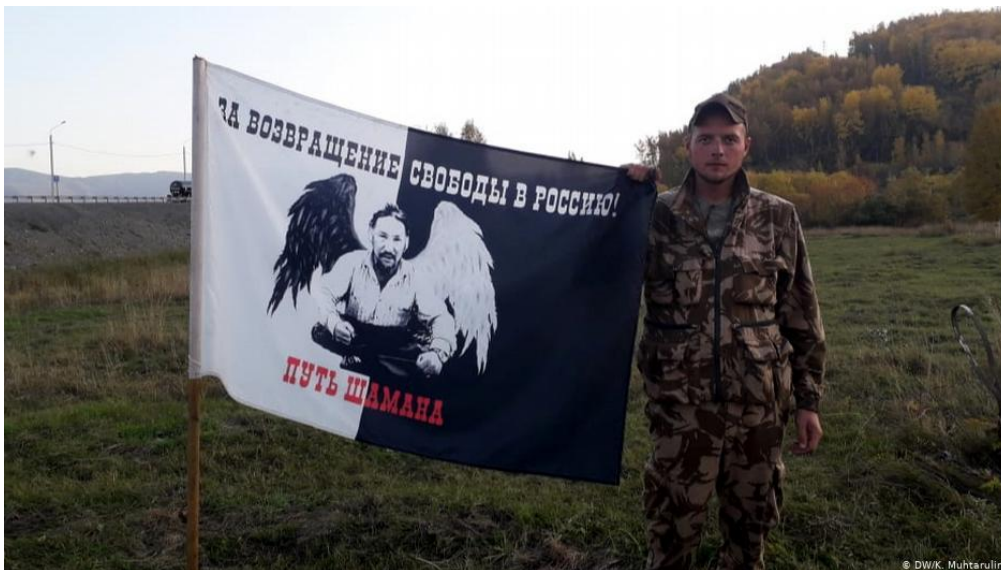
Figure n° 8 : Capture d'écran « Pour le retour de la liberté en Russie. La voie du chamane ».

Au-delà des controverses et des soutiens que le « chamane » sibérien aura pu inspirer, il est révélateur de voir qu'à l'égal des Khanty et aux Mansis qui n'avaient pas hésité à parer leurs divinités tutélaires des emblèmes d'un pouvoir exogène autrefois, les transcendant en cavaliers célestes vêtus à la russe, pour agir sur le monde, aujourd'hui c'est la figure de Sachka-chamane qui a bientôt été parée d'attributs chrétiens orthodoxes – les ailes d'un ange ou les traits d'une icône. Comme pour l'armer plus efficacement dans sa mission rituelle, comme pour rappeler au formalisme de l'Église orthodoxe russe la folie de saint Maxime de Moscou qui, déjà au XV e siècle, déplorait ces maisons qui ont un coin aux icônes, mais une conscience à vendre, et le Signe de Croix qu'on professe mais qui n'est pas une prière.