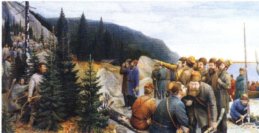
Fig. n°1. La conquête de la Sibérie selon le peintre khanty Mitrofan Tebetev (1978)

Mon séjour forcé en Extrême-Orient dura plus de dix-huit ans. Constamment désireux de retrouver ma terre natale, je me suis évertué, autant que possible, à me débarrasser du douloureux sentiment d'être un exilé asservi, arraché de ceux qui m'étaient les plus chers. C'est ce qui m'a naturellement fait me tourner vers les indigènes de Sakhaline, les seuls à éprouver de l'attachement pour cette terre, la leur depuis des temps immémoriaux, détestée par ceux qui y avaient créé le bagne. (Piłsudski 1912)