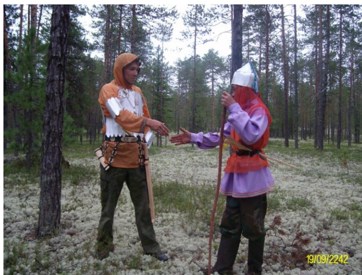
Figure n° 10 : Un prince khanty et Ermak, saynète de théâtre ; campement ethnographique pour la jeunesse autochtone

En contrepoint de la volonté des autorités d'écrire un narratif qui unifierait les corps politique et social pour défendre la nation menacée par d'éternels ennemis, les récits de vie collectés attestent que, dans l'incertitude du lendemain provoquée par l'État russe et sa logique de sédentaire qui menace le mode de vie autochtone, la force humaine est parfois bien plus dangereuse que les forces naturelles et surnaturelles des toundras et des taïgas.