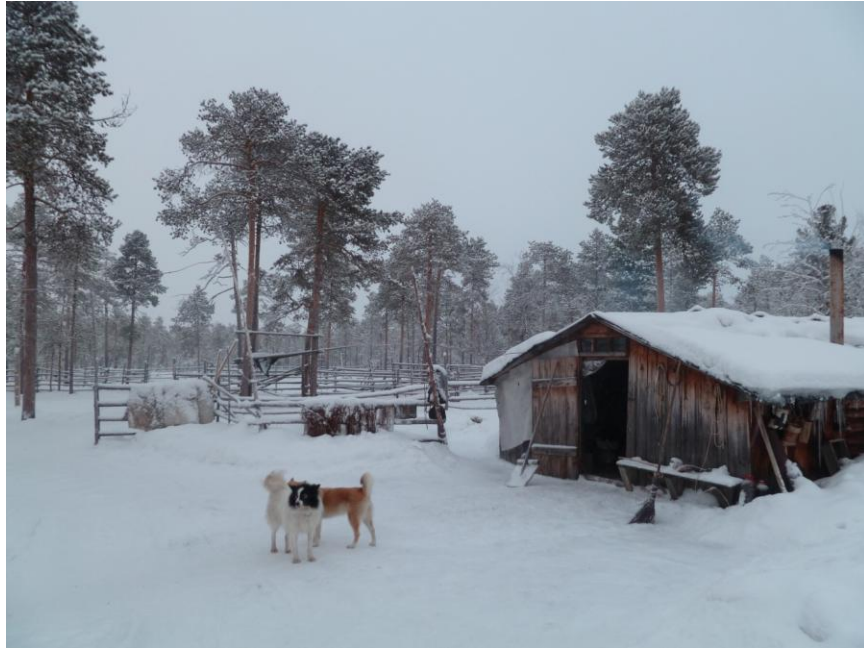
Figure n° 6 : Campement d'automne

La plupart de ceux qui mènent encore un mode de vie traditionnel ( традиционники ) sont reliés à la terre « avec » laquelle ils vivent, non seulement par des liens physiques, mais aussi mentaux, émotionnels et spirituels. Mais à la tête depuis mai 2021, et ce pour deux ans, du Conseil de l'Arctique 56 , la Russie a officialisé sa nouvelle bataille : « Lomonossov a dit que la Russie grandirait par la Sibérie. Au cours des prochaines décennies, la Russie va grandir par l'Arctique et les territoires du Nord. Ce sont des choses assez évidentes ». Le rêve de l'écrivain Youri Rytkhéou de voir, dans un avenir suffisamment proche, la neige retrouver sa blancheur sur tout le littoral de la toundra et l'homme du Nord se sentir le maître réel de son existence, si fragile et palpitante dans cette contrée des froids longs et sévères 57 , s'éloigne une fois encore. L'expansion industrielle est une troisième forme de conquête.