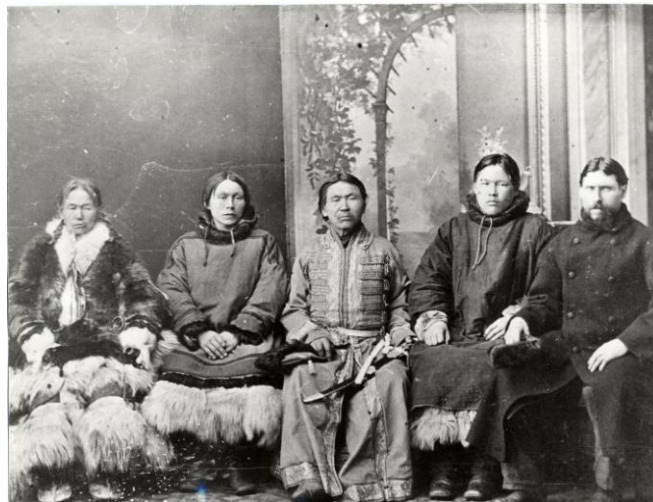
Figure n°3. Le prince Taïchine au centre, son épouse, ses deux fils et son interprète (Obdorsk, fin XIX e siècle) ; © avec l'aimable autorisation du Complexe muséal Chemanovski de Salekhard

Youri, Arctic Mirrors: Russia and the Small Peoples of the North , Ithaca & L.: Cornell Univ. Press, 1994 ; Steller, Georg V., Описание земли Камчатки [Description de la terre du Kamtchatka], Kamčat. pečat. dvor, Petropavlovsk-Kamtchatski, 1999 ; Patkanov, Serafim, Очерки колонизации Сибири. Сочинения в двух томах [Essai sur la colonisation de la Sibérie. Œuvres en deux tomes], vol. 2., Éditions Yu. Mandrika, Tioumen, 1999.