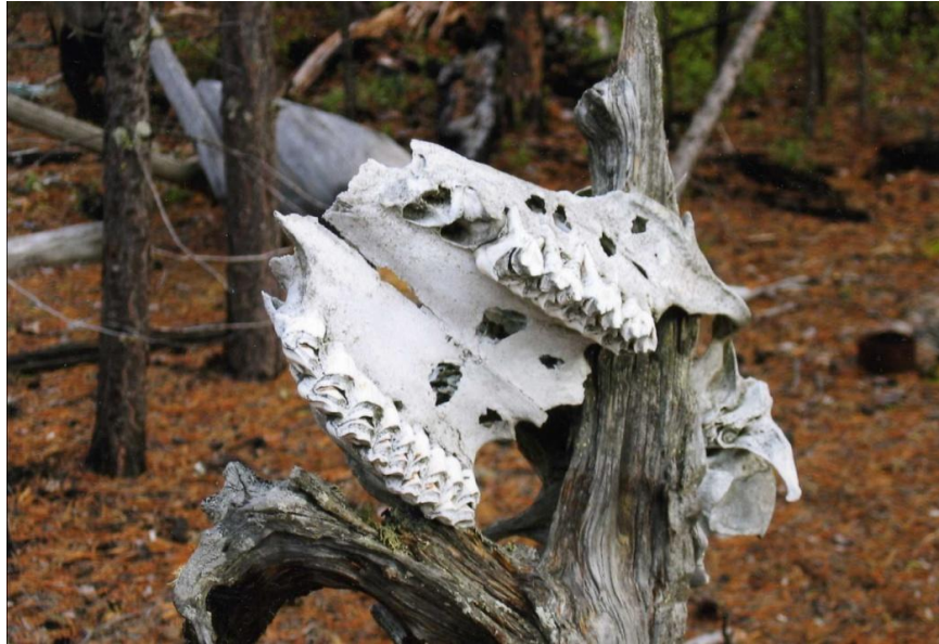
Figure n°7: Détail d'un village saisonnier khanty abandonné lors du boom pétrolier

Lors de l'édition 2010 du forum « Arctique, terre de dialogue », le discours officiel des autorités était clair : « La Russie a quelques priorités dans sa politique arctique. La première : la création de conditions de confort et de qualité de vie pour les gens, la préservation du mode de vie original des peuples autochtones. Aucun projet industriel ne verra le jour sans considérer les exigences écologiques. C'est le principe de base de la position du gouvernement. La grandeur de l'Arctique est au-dessus de ces barils de pétrole et volumes de gaz dont nous pouvons bénéficier. » Youri Vella aura attendu en vain l'adéquation entre les discours officiels et le terrain, proposant sa propre lecture de la réalité dans son poème « Valeur suprême » qui a en exergue Дети – наше будущее (из выступлений российских лидеров) [« Les enfants sont notre avenir (extrait des discours des leaders russes) »]: