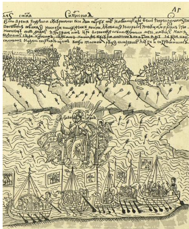
Figure n°2. « Et après l'apparition du Sauveur, Ermak et les Cosaques virent que la bannière à Son image, vénérée parmi les Cosaques, se déplaçait elle-même en aval, le long de la rive gauche. Les impurs décochèrent des flèches sans nombre, telle la pluie, depuis la montagne jusque sur les barques. Mais Dieu protégea l'endroit, et Ermak et les siens le traversèrent, sans qu'un seul de leurs cheveux ne tombât. Une fois qu'ils furent à bon port, la bannière avait repris sa place » 6 .

« soumission et fidélité à la Russie, en baisant un sabre teint de sang », les Tatars égorgés pendant leur sommeil et des Cosaques qui « se baignent dans le sang des infidèles » 3 : toutes ces morts ne sont que le cadavre de « la vieille Sibérie » païenne ou mahométane, monde inique et corrompu qui s'est condamné lui-même pour renaître grâce aux « chrétiens étincelants comme des chandelles » 4 de l'orthodoxie russe. Par la conquête, les Russes révèlent moins l'Asie septentrionale au monde civilisé, qu'ils ne révèlent le dessein divin dont ils sont le bras armé. Les chroniques n'affirment-elles pas que Dieu a doté Ermak de la force et de la vaillance et que le Christ est du côté des conquérants, qui bénit les batailles, la politique d' amanat (prise d'otages) et la mort répandue en son nom ? Ainsi l'annexion de la Sibérie devient-elle juste, et le droit du plus fort, une vertu 5 .