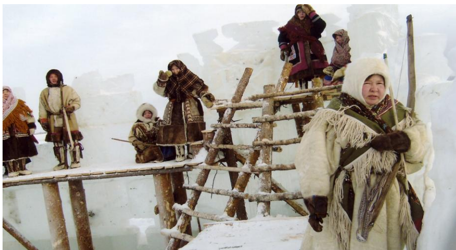
Figures n° 4 & 5 : Scènes du tournage de [La glace rouge] La saga des Khanty d'Oleg Fesenko (2009)

Le discours russe, tout à sa lutte des classes et sa chasse aux ennemis du peuple, ne voit dans cette résistance qu'un mouvement contre-révolutionnaire, aussitôt réprimé dans la violence. À l'issue de cette résistance, dans le Kazym, la chasse à l'homme menée par des commandos punitifs fut exemplaire et l'affaire n° 2/49, Du soulèvement armé contre le pouvoir soviétique des Autochtones de la toundra du Kazym , instruite en 8 tomes. La « richesse » des contre-révolutionnaires fut inventoriée et confisquée au profit de l'État : 979 rennes, diverses fourrures pour une valeur de 2 095 roubles et 11 kopecks, des baies, de la viande de renne pour quelque 2 000 roubles, du poisson à hauteur de 89 roubles 65 kopecks 49 . Encore en 1993, la demande des familles de réhabiliter les leurs a été rejetée par le Parquet de Tioumen.