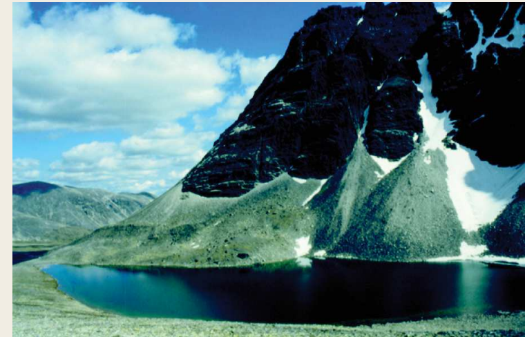
Figure 5 : Cônes et talus d'ébouilis développés à la base de parois quartzitiques du Rondslottet dans le massif des Rondane en Norvège (61°55'N, 9°52'E entre 1450 et 2000 m d'altitude)

Dans sa volumineuse thèse d'État sur les versants quartzitiques dans les montagnes de l'Europe du Nord-Ouest (Irlande, Écosse, Norvège) soutenue le 3 mai 2002, Dominique Sellier consacre une large part de son étude à l'ébouilisation. En effet, si les roches quartzitiques sont résistantes à l'érosion chimique du fait de la recristallisation de cette roche métamorphique siliceuse, elles sont très