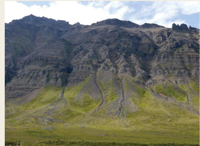
Figure 7 : Cônes d'éboulis partiellement fossilisés, cônes torrentiels et coulées de débris actives sur un versant basaltique du Tindastól dans la région du Skagafjörður en Islande (65°78'N, 19°61'W)

Dans ses travaux de thèse de doctorat d'État sur les versants du Spitsberg, soutenue le 8 novembre 1991, dont Jean Malaurie fut président du jury, Marie-Françoise André (1991) analyse notamment des vitesses d'érosion à partir de calage chronologique basée sur l'utilisation de la lichénométrie. Les taux de recul des parois du Svalbard proposés par Marie-Françoise André vont de 0 à 1 580 mm par millier d'années. Dans le nord-ouest et le centre du Spitsberg, un recul des parois rocheuses à trois vitesses est suggéré (André, 1997). Pour les deux derniers millénaires : un écaillage biogénique très lent (2 mm ka-1), un recul modéré dû à l'éclatement par le gel (100 mm ka-1) et un recul rapide associé à la relaxation des contraintes postglaciaires (environ 1 000 mm ka-1). L'examen de la répartition des divers processus indique que le recul holocène de la plupart des parois rocheuses n'a pas dépassé un ou deux mètres. Les données lithologiques des roches