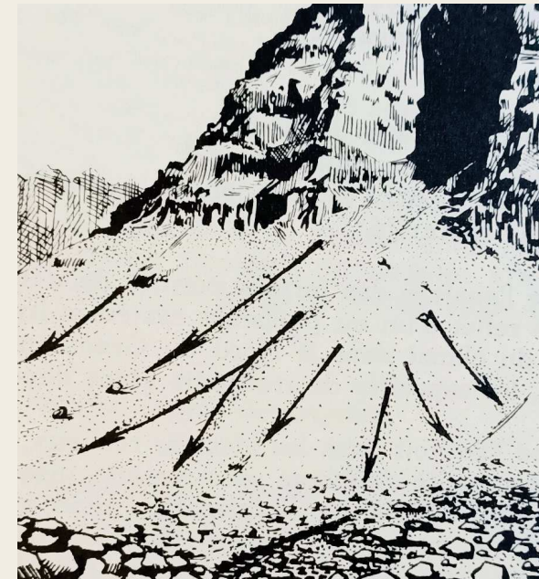
Figure 3 : Cône d'éboulis torrentiel, versant basaltique de Godhavn, île de Disko, août 1949

maximum n'est que rarement atteint (French, 2018). Les principaux enseignements sur ces paramètres thermiques des roches et des sols sont résumés dans une synthèse récente sur la géomorphologie périglaciaire (Ballantyne, 2018). Le taux de transfert de chaleur dans la roche est déterminé par sa diffusivité thermique (conductivité thermique divisée par la capacité thermique volumétrique), mais cela est compliqué par les effets de la chaleur latente, de sorte que le gel et le dégel peuvent temporairement s'arrêter à 0°C (« zero curtain effect » (Ballantyne, 2018)). Il n'existe pas de température unique à laquelle l'eau gèle dans les roches, mais la proportion d'eau non gelée présente diminue à mesure que la température descend en dessous de 0°C. L'eau liquide présente dans la roche à des températures inférieures à 0°C, appelée "eau pré-fondue", existe en raison des effets de tension superficielle, de la présence d'impuretés dissoutes qui abaissent le point de congélation de l'eau et des effets de capillarité et d'adsorption. En laboratoire, les expériences