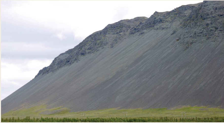
Figure 6 : Versant basaltique en cours de régularisation en Islande de l'ouest (64°21'N, 21°86'W)

sensibles à l'érosion mécanique périglaciaire, notamment vis-à-vis de la macro-gélifraction à cause de l'abondance des discontinuités dont les plans de stratification (fig. 5). À l'aide de transects topo-sédimentologiques, Dominique Sellier montre toute la variété des cônes d'éboulis et des dynamiques à l'œuvre, depuis les éboulis liés à la gravité pure, jusqu'au éboulis remaniés par le ruissellement, les avalanches ou le fluage. Dans son analyse des temporalités, il montre le rôle majeur des processus de décohésion des parois suite au départ des glaciers et la mise en place des éboulis dans les tous premiers temps de la déglaciation. Son analyse des versants réglés, témoignant de l'aboutissement et de l'arrêt du processus d'ébouilisation, propose une mise en place rapide dans les roches quartzitiques, dans les seuls temps post-glaciaires au moins pour ceux développés dans les cirques (Sellier et Kerguillec, 2019 ; fig. 6).