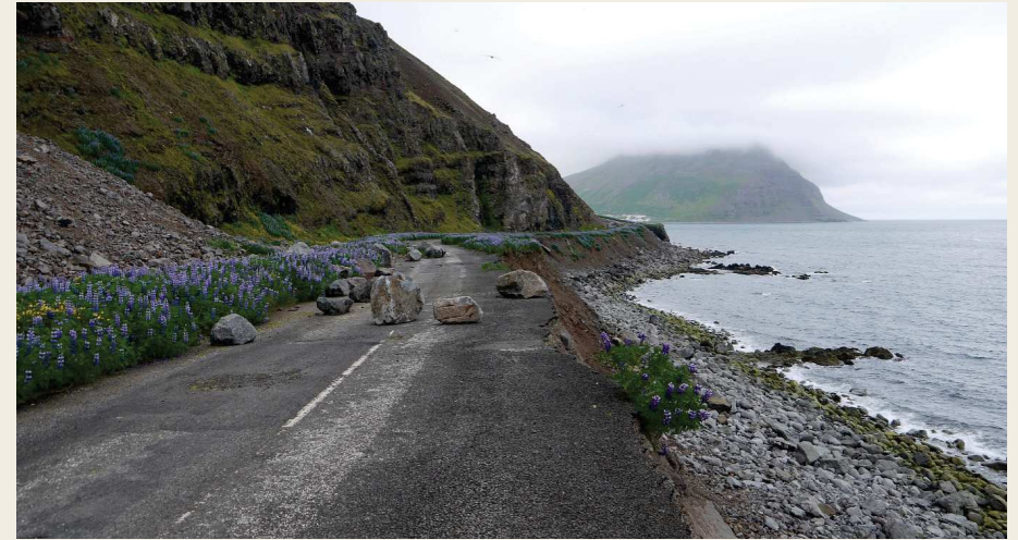
Figure 8 : Les chutes de pierres, sur un versant basaltique dans l'axe d'un cône torrentiel (dont la partie distale est visible à gauche du cliché), et l'érosion littorale ont conduit les autorités islandaises à fermer la route côtière permettant de relier Ísafjörður et Bolungarvík dans la région des Westfjords. Un tunnel creusé dans la montagne permet depuis 2010 de relier les deux localités distantes d'une quinzaine de kilomètres (66°05'N, 23°09'W)

Dans le contexte actuel du réchauffement climatique et de l'augmentation de la fréquentation de la haute montagne, les impacts des chutes de pierre sont parfois dangereux pour l'Homme. À cette fin, des approches par modélisation cherchent à prédire les zones d'instabilité et les zones à risque pour les hommes et les infrastructures (Dorren, 2003). Amorcée avec la fin du Petit Âge Glaciaire, la fonte contemporaine des glaciers déstabilise l'équilibre des versants (Fischer et al., 2006 ; Deline et al., 2012 ; Knoflach et al., 2021). Celle du pergélisol de parois est responsable de l'accroissement des écroulements rocheux comme l'ont très bien démontré les études réalisées dans le Massif du Mont Blanc (Ravanel et Deline, 2015 ; Ravanel et al., 2013, 2017). Au-delà de ces deux phénomènes d'ampleur qui rendent plus difficiles techniquement et plus dangereuses certaines courses d'alpinisme (Mourey et al., 2019a et 2019b),