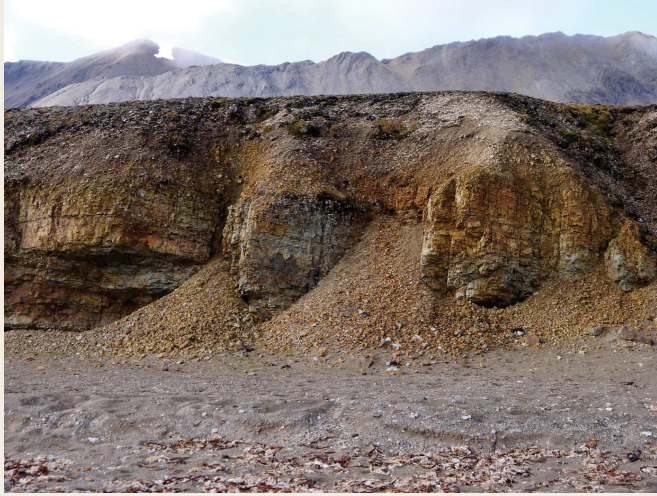
Figure 4 : Sensibilité à la gélifraction des falaises calcaires dès le niveau de la mer sur la presqu'île de Brøgger (Ny-Ålesund, Spitsberg nord-occidental, 78°55'N, 11°55'E)

menées notamment à Caen, ont montré l'influence de la vitesse de congélation, plus que l'intensité du refroidissement (Lautridou et Ozouf, 1978). La fracturation mécanique des roches soumises au stress lié à l'augmentation volumétrique de 9 % lorsque l'eau passe de l'état liquide à l'état solide dépend largement des discontinuités de la roche à différentes échelles (pores, fissures, joints...). La force de la liaison intergranulaire détermine aussi la résistance à la traction des roches intactes, et donc leur sensibilité à la fracturation ou à la désagrégation, mais elle varie fortement entre les types de roches. Les roches ignées, comme les granites ou les basaltes, et métamorphiques, comme les quartzites, pour lesquelles les grains sont soudés entre eux, sont très résistantes alors que les roches sédimentaires, comme les calcaires ou les grès, pour lesquelles les grains sont seulement cimentés ensemble, la résistance à la cryoclastie est plus faible (fig. 4). La porosité des roches varie de l'une à l'autre et ce paramètre détermine la quantité d'eau qu'une roche peut contenir. Si les roches magmatiques présentent souvent une porosité inférieure à 2 %, les roches sédimentaires peuvent atteindre 30 %. Or, pour un type de roche donné, la résistance à la traction a tendance à diminuer lorsque la porosité augmente. De plus, la porosité d'une roche