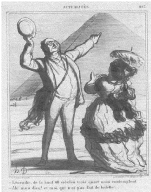
Ill. 4 : « – Léocadie, de là-haut 40 siècles et trois quarts nous contemplent. – Ah ! mon Dieu ! et moi qui n'ai pas fait de toilette ! » Dessin d'Honoré Daumier, Le Charivari , 27 novembre 1869.

les pyramides) en compagnie de sa femme qui n'a d'yeux que pour ses propres vêtements (Ill. 4) : « – Léocadie, de là-haut 40 siècles et trois quarts nous contemplent. – Ah ! mon Dieu ! et moi qui n'ai pas fait de toilette ! »