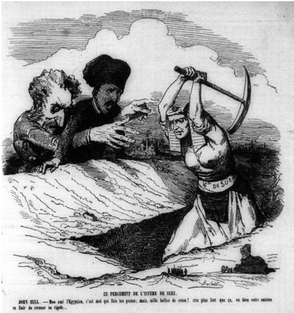
Ill. 2 : « Le percement de l'isthme de Suez » Dessin de Bertall, Le Charivari , 16 janvier 1864.