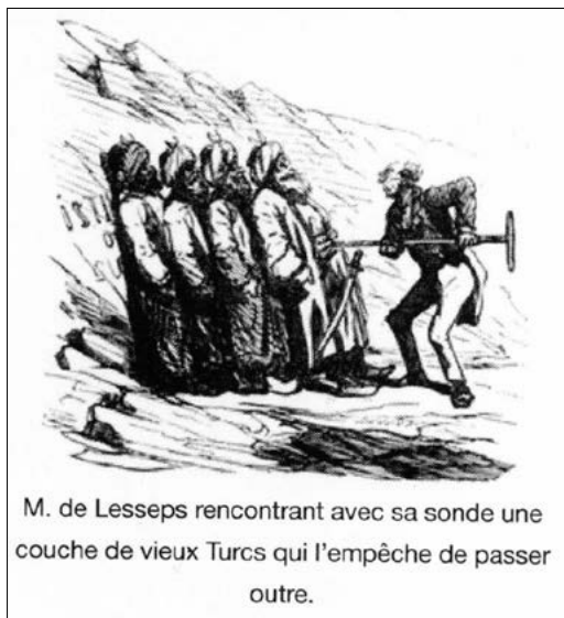
M. de Lesseps rencontrant avec sa sonde une couche de vieux Turcs qui l'empêche de passer outre.