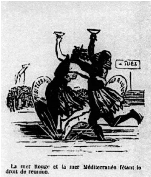
Ill. 3 : « La mer Rouge et la mer Méditerranée fêtant le droit de réunion »

Dessin de Cham, Le Charivari , 26 septembre 1869.