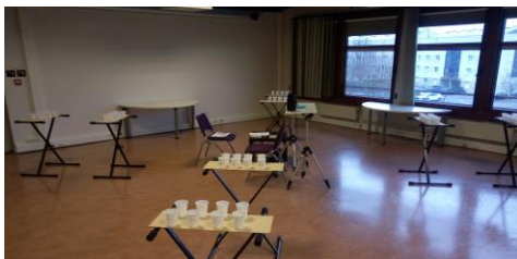
FIGURE 1 : Photo du dispositif expérimental

Entre chaque étape, de la musique est diffusée par des hauts parleurs placés derrière les oreilles du sujet pour le faire patienter et dissimuler les pas du locuteur expert, lequel a prétexté dès le début de l'expérience avoir une fracture de l'orteil pour pouvoir ôter ses chaussures et se déplacer en chaussettes. Le sujet et le locuteur expert portent un micro serre-tête Sennheiser HSP 4 relié à un émetteur radio afin que leur échange soit enregistré.