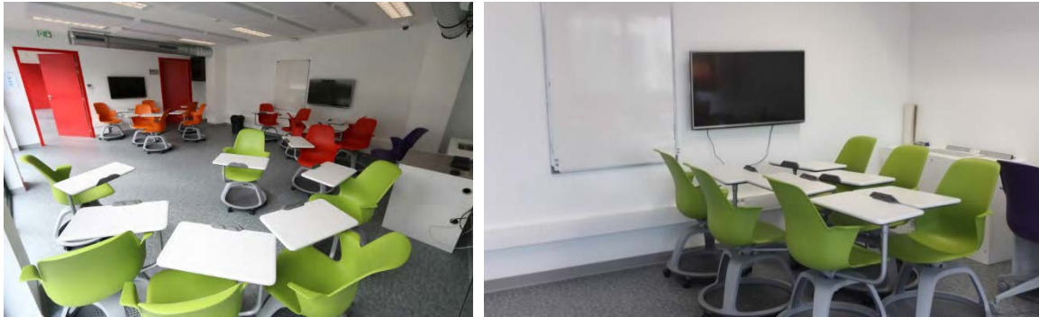
Fig. 2 : Creative Lab de niveau 1.

A la suite des premiers retours d'expérience de la pédagogie A2P2, de nouvelles configurations d'espace et de mobilier ont été imaginées et mises en place. Trois salles ont été équipées de mobilier individuel mobile (fauteuils et tablettes intégrés) à titre d'expérimentation. Ces salles ont été nommées Créative Labs car leur aménagement totalement flexible et non hiérarchique est particulièrement adapté pour les séances de créativité. Deux salles ont été équipées en Créative Labs de niveau 1 (Fig. 2), avec des postes de travail mobiles, un écran plat et un tableau blanc pour chaque groupe de 6. Le Créative Lab de niveau 2 est équipé de tableaux blancs tout autour de la salle et de vidéoprojecteurs interactifs, et est de ce fait moins comparable aux salles Scale-Up.