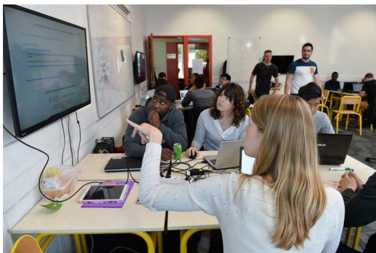
Fig. 1 : Salle scale-up.

A la rentrée 2015, le CESI a déployé sa nouvelle forme de pédagogie, nommée A2P2 (Apprentissage Actif Par Projets), sur l'ensemble des sites et des spécialités de son école d'ingénieurs. Cette transformation de la pédagogie a entraîné une évolution des espaces d'apprentissage. Les salles de classe traditionnelles ont été aménagées en salles « Scale-Up » (inspirées du projet SCALE-UP, Beichner et al. , 2007) : chaque groupe projet étant constitué de 6 membres, les bureaux individuels pour les apprenants ont été ré-agencés en îlots de 6 (Fig. 1). Un écran plat et un tableau blanc ont été mis à disposition de chaque îlot / chaque groupe pour la réflexion collective et le partage d'informations.