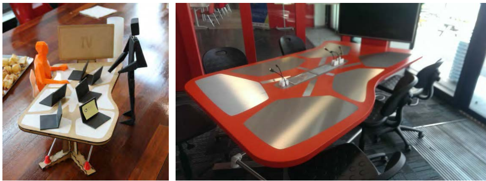
Fig. 3 : Table A2P2 (maquette échelle réduite et prototype fonctionnel).

du groupe est également incitée par l'utilisation de chaises roulantes et tournantes autour de la table. D'autres fonctionnalités ont été intégrées pour soutenir la collaboration : six connecteurs permettent de brancher jusqu'à six ordinateurs sur l'écran partagé et le basculement d'un ordinateur à l'autre se fait par de simples boutons poussoirs (un en face de chaque personne) ; les emplacements de travail individuels sont matérialisés et protégés par des inserts en aluminium ou en résine, selon les modèles, de sorte à accueillir également de petits travaux de maquettage sur la table. Enfin, les tables et chaises ont été rehaussées (hors modèles PMR) pour minimiser l'intrusion lors du passage du formateur dans le groupe : le formateur étant debout, il se trouve à la même hauteur que les membres du groupe autour de la table et n'est pas en position dominante lorsqu'il vient interagir avec eux.