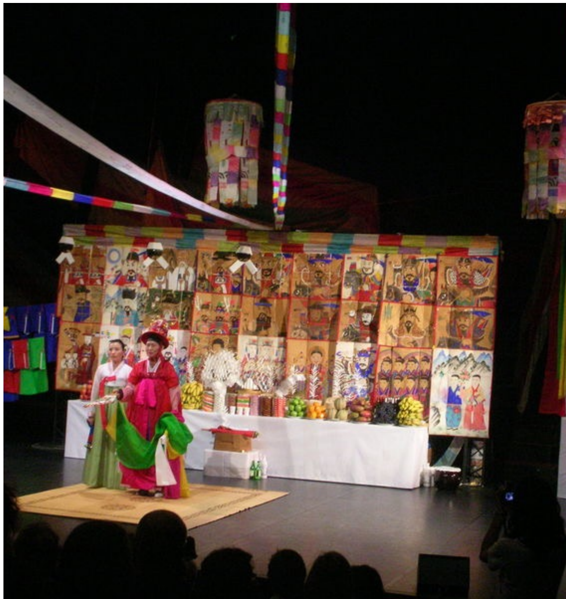
Un spectacle de KIM Keum-hwa, au musée du Quai Branly, Paris, le 5 oct 2010