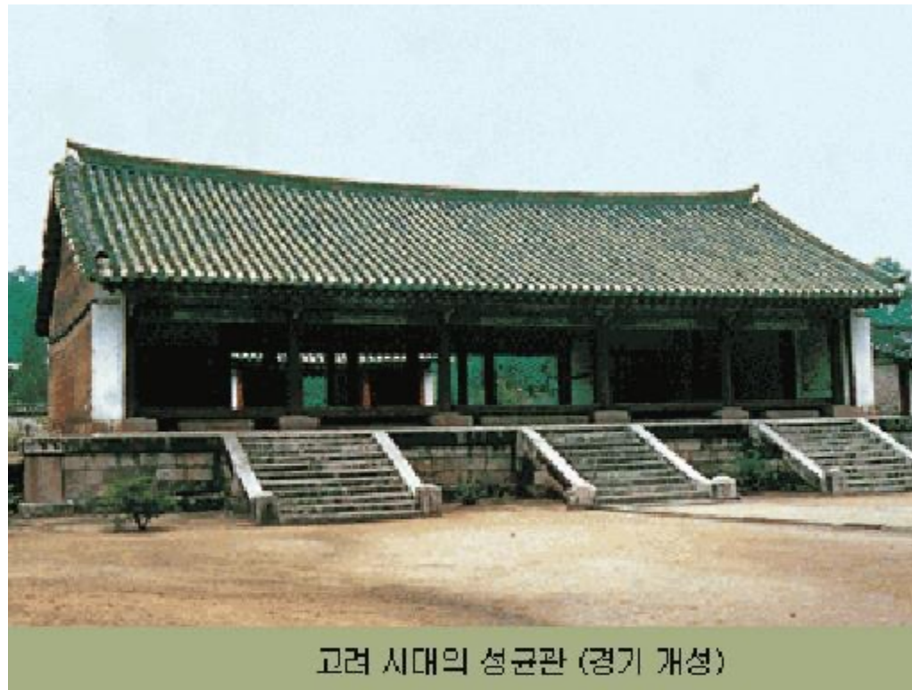
고려 시대의 성균관 (경기 개성)