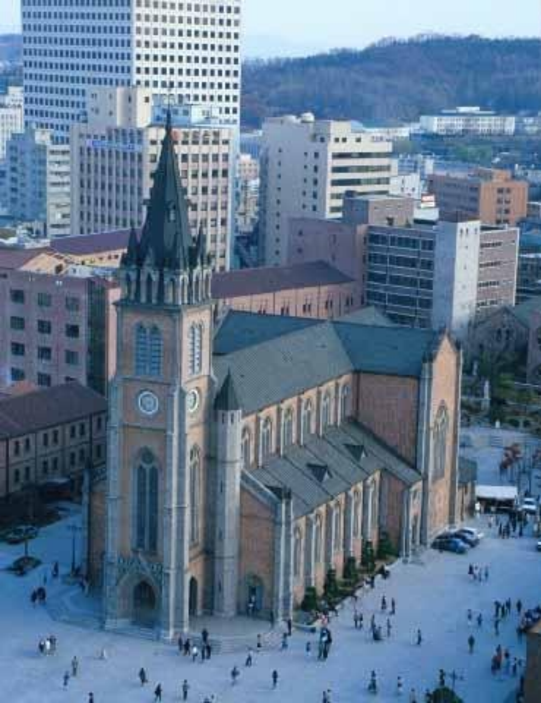
Cathedrale de Myöngdong