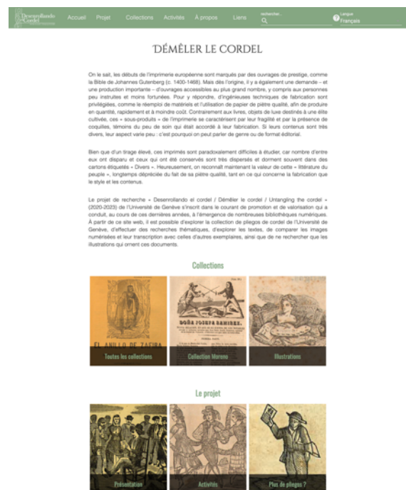
Figure 2 : Première version de la page d'accueil

Ainsi, la nouvelle page d'accueil (Figure 3) met l'accent, non plus sur le texte, qui a été réduit à l'essentiel, mais sur les images, celles-ci invitant davantage à l'exploration (Norman, 2007). Pour aller plus loin, nous avons également mis en avant