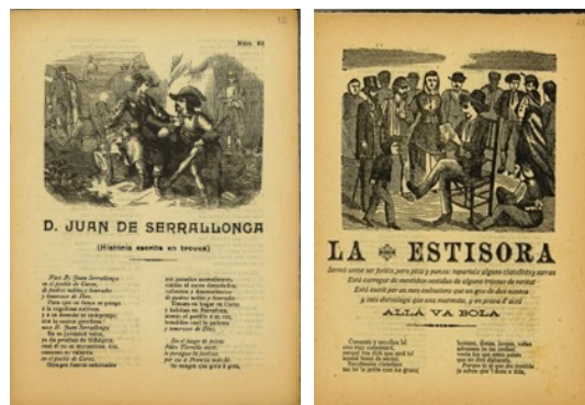
Figure 1 : Exemples d'imprimés de colportage

Depuis avril 2022, la bibliothèque numérique (BN) Démêler le cordel (2020-2024) 1 propose de découvrir une collection d'imprimés de colportage espagnols ( pliegos de cordel ), datés du XIX e siècle et conservés à la Bibliothèque universitaire de Genève (Figure 1). Pour valoriser et exploiter la richesse de ces documents, restés pendant longtemps à la marge des études littéraires traditionnelles, deux parcours ont été mis en place. Le premier s'intéresse aux textes (Leblanc et Carta, 2021). Les utilisateurs peuvent consulter les transcriptions des imprimés, y effectuer des recherches, ainsi que visualiser plusieurs facsimilés en parallèle. Le second parcours est consacré aux gravures sur bois qui ornent la quasi-totalité des documents. Un catalogue offre aux utilisateurs la possibilité de rechercher des éléments figuratifs et de consulter une gravure en particulier, ses