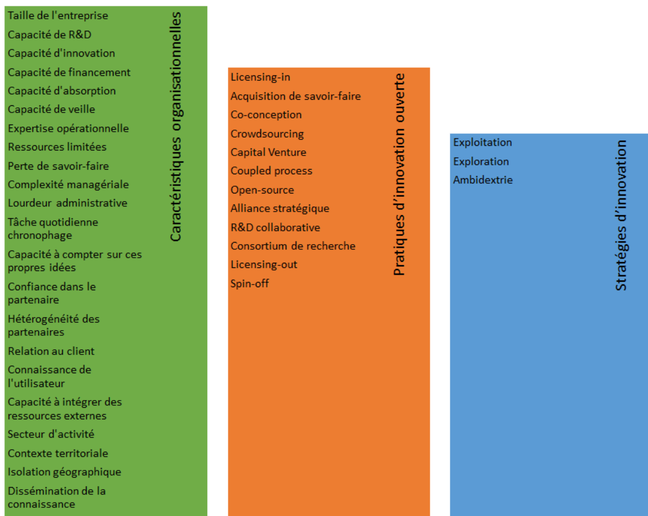
Figure 2 : Cadre conceptuel