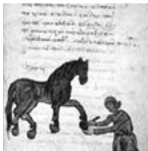
FIG. 2. Voss. Gr. Q°50, f. 118.