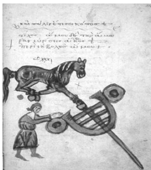
FIG. 4. Voss. Gr. Q°50, f. 114.

2. Hippiatria e Mascalcia ai tempi di Federico II. 2. 1. Il medico dei cavalli. Generalità. – Nel lungo e faticoso iter dell'addomesticamento delle diverse specie animali che hanno avuto un ruolo importante, quasi indispensabile, nella vita dell'uomo, ritroviamo il cavallo che, sin dalla