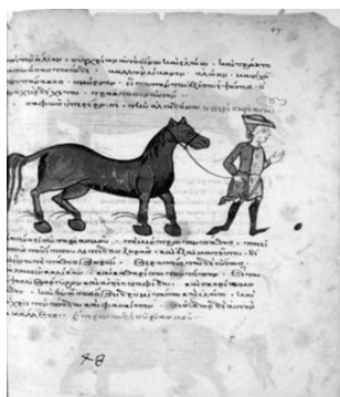
FIG. 1. Paris. Gr. 2244, f. 49r.