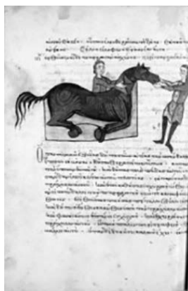
FIG. 3. Paris. Gr. 2244, f. 54v.